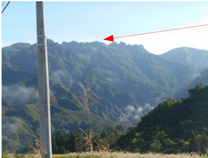
山の頂上がハツ峰です。 中手原バス停より

1日目 今回のコースは 屏風道(下山禁止)ルートを小屋まで行きます。4合目までは 難らかなコースですが 4合目以降は 鎖場が40箇所あり又 1つの鎖場がかなり長い コースです。