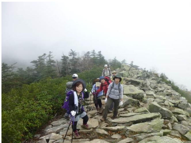
最初の難関のガレ場