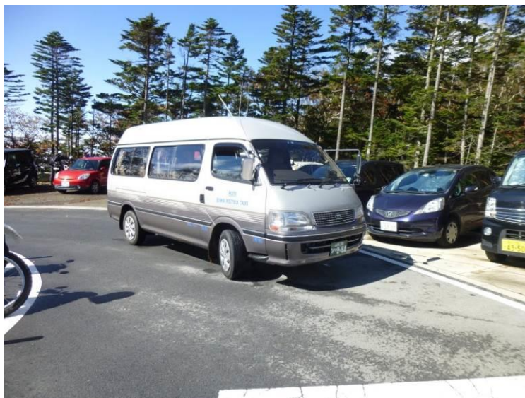
柳平で乗り換えたジャンボタクシー（¥800）大弛峠