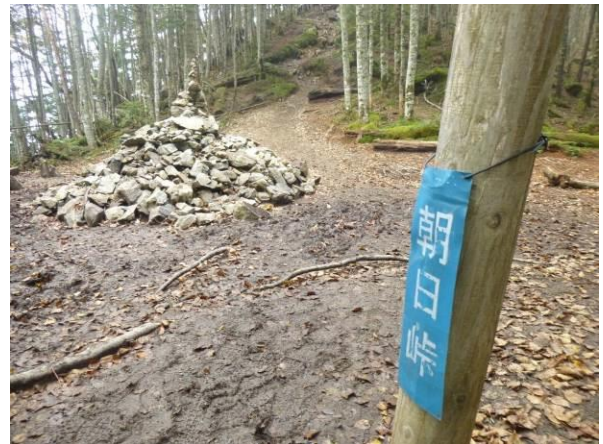
朝日峠まで戻りました