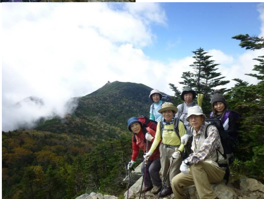
金峰山をバックに記念写真 (朝日岳)