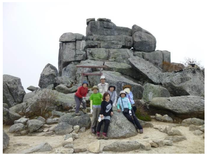
五丈岩をバックに若者グループに撮って貰った。