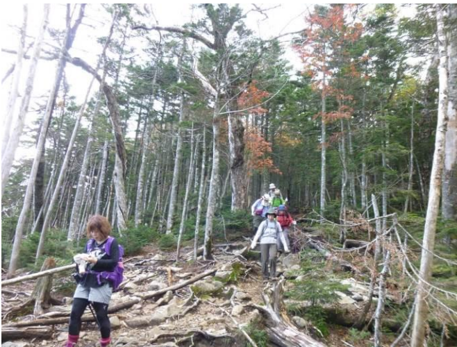
木が枯れてしまった広場