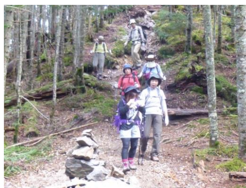
朝日峠に着きました。ケルンが積まれていました。