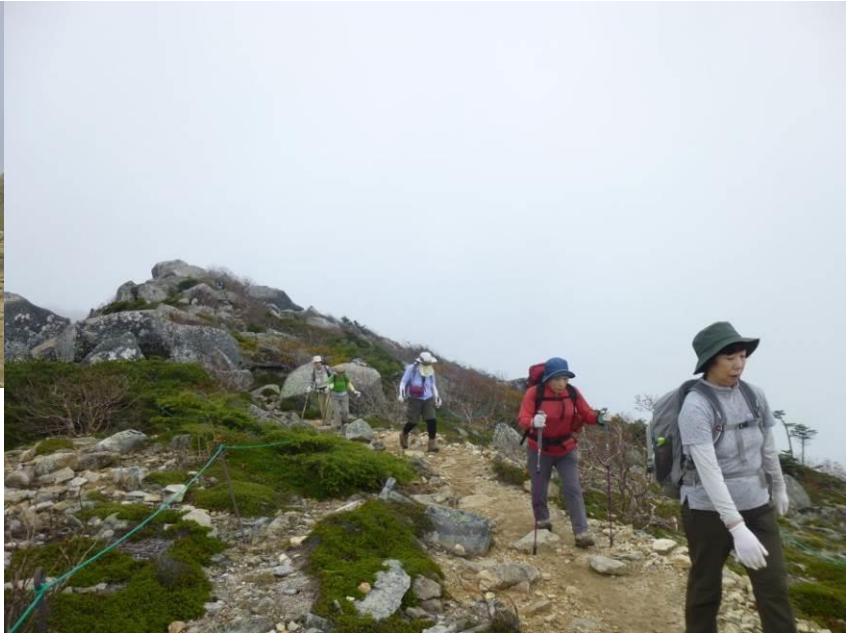
名残が付きませんが山頂を後にして下山開始