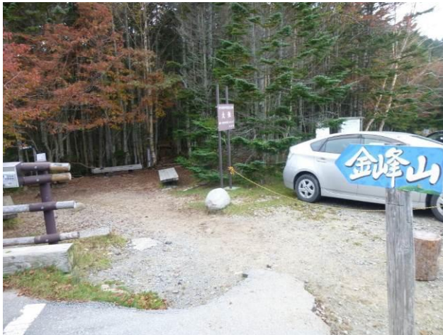
登山口に無事下山、 お疲れさまでした。