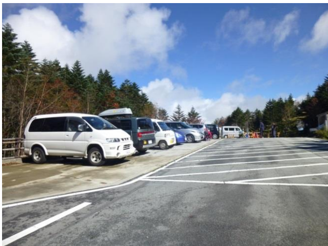
大弛峠 こんな立派になっていてびっくりしました。青空です。