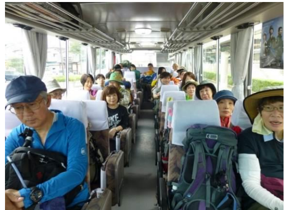
3年前から営業を始めた栄和交通のバス（¥1000）塩山駅前