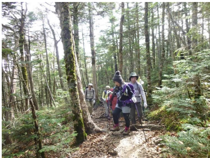
樹林の中を延々と進みます