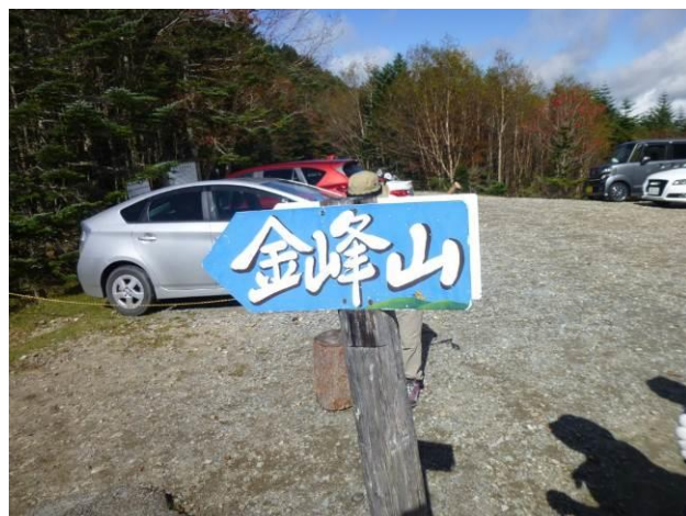
長野県と山梨県の県境、長野県側は舗装されていません。