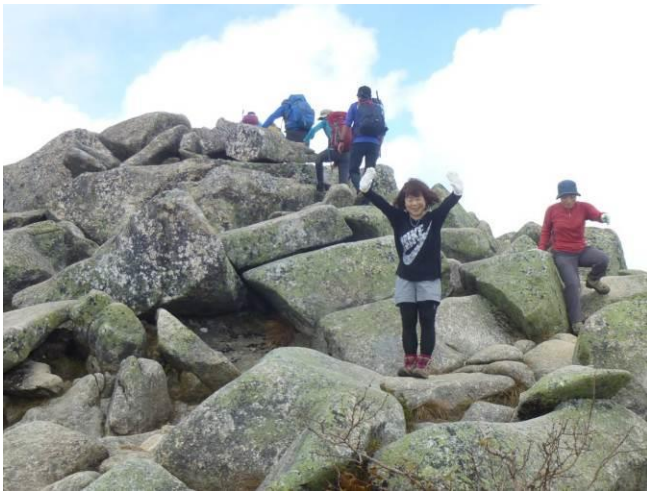
わらびの乙女Kさん