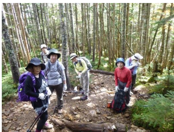
急行の方々に道を譲ります。