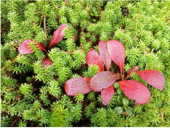
紅葉しているウラシマツツジ