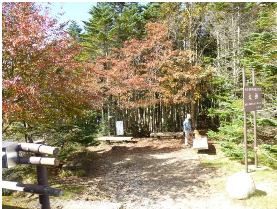
金峰山の登山口 紅葉が始まっています。