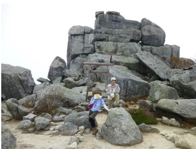
先行した二人が悠然とかまえています。