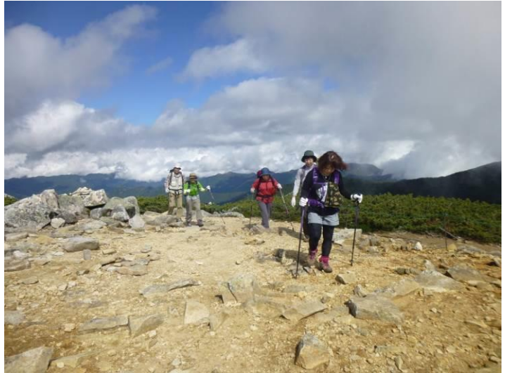
雄大な尾根を進みます、気持ちいいー