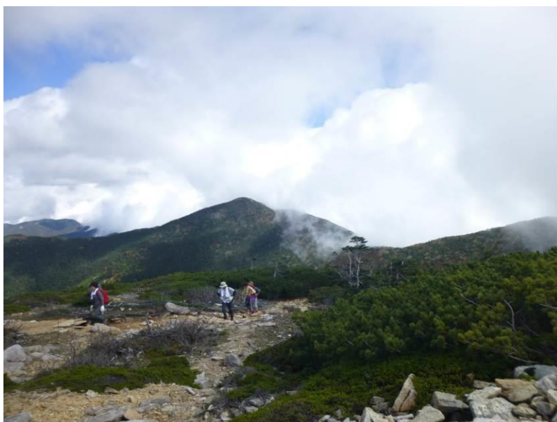
歩いてきた朝日岳 を振り返る