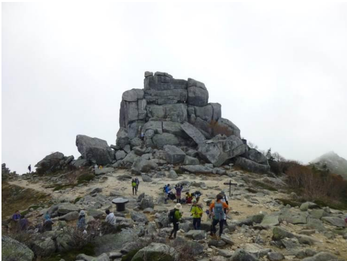
かの有名な五丈岩です