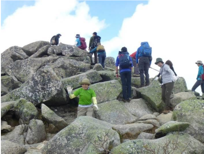
わらびの乙女Yさんが五丈岩を目指します