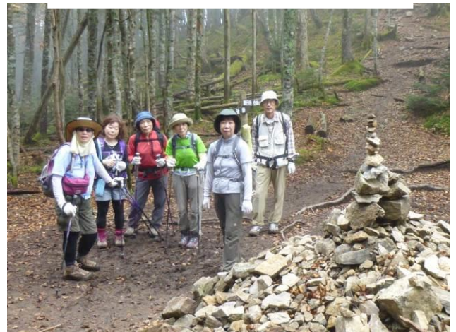
ケルンを前に（朝日峠）