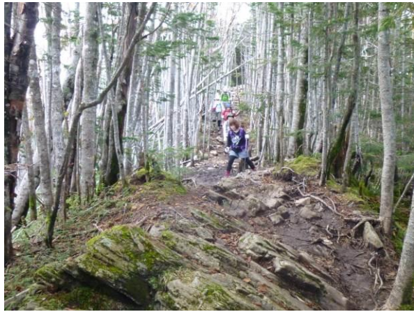
下りに入りました。