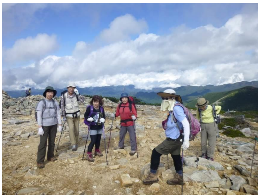
森林限界を超えました。 初めて経験する景色に感激！