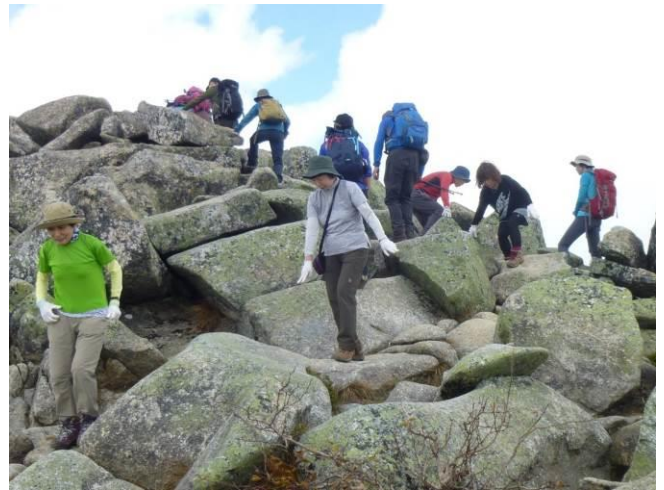
わらびの乙女Oさん