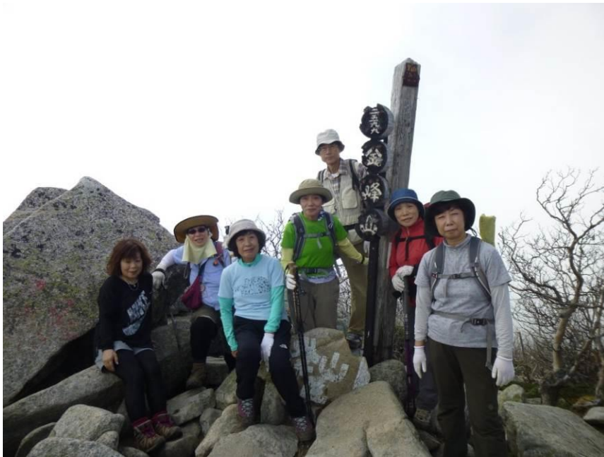
金峰山 山頂に到着、岩場なので足元が極端に悪い