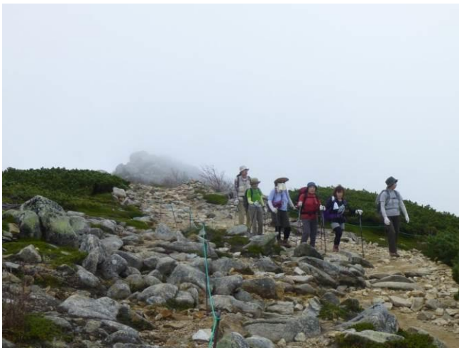
山頂は霧に隠れてしまいました。