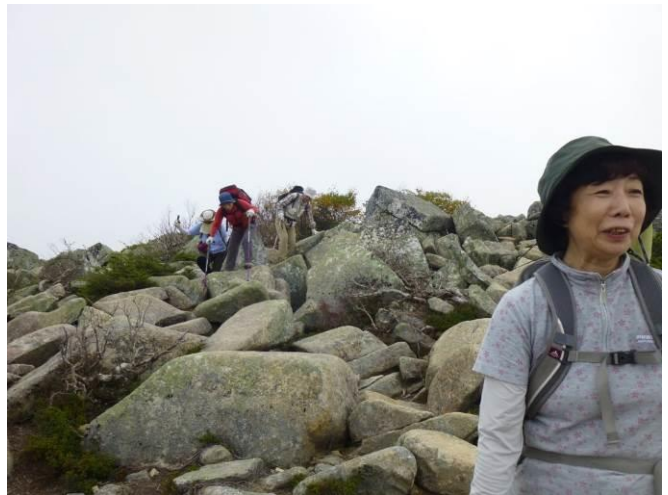
岩場の連続、後方で苦戦しています。