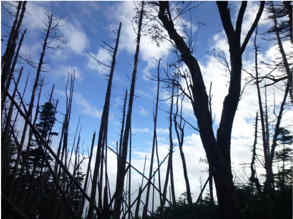
再び青空が戻りました、立ち枯れの木々が痛々しい