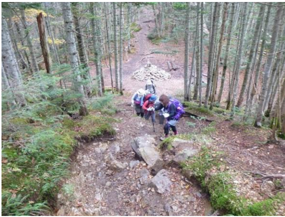
キツイ登りはここで最後です。