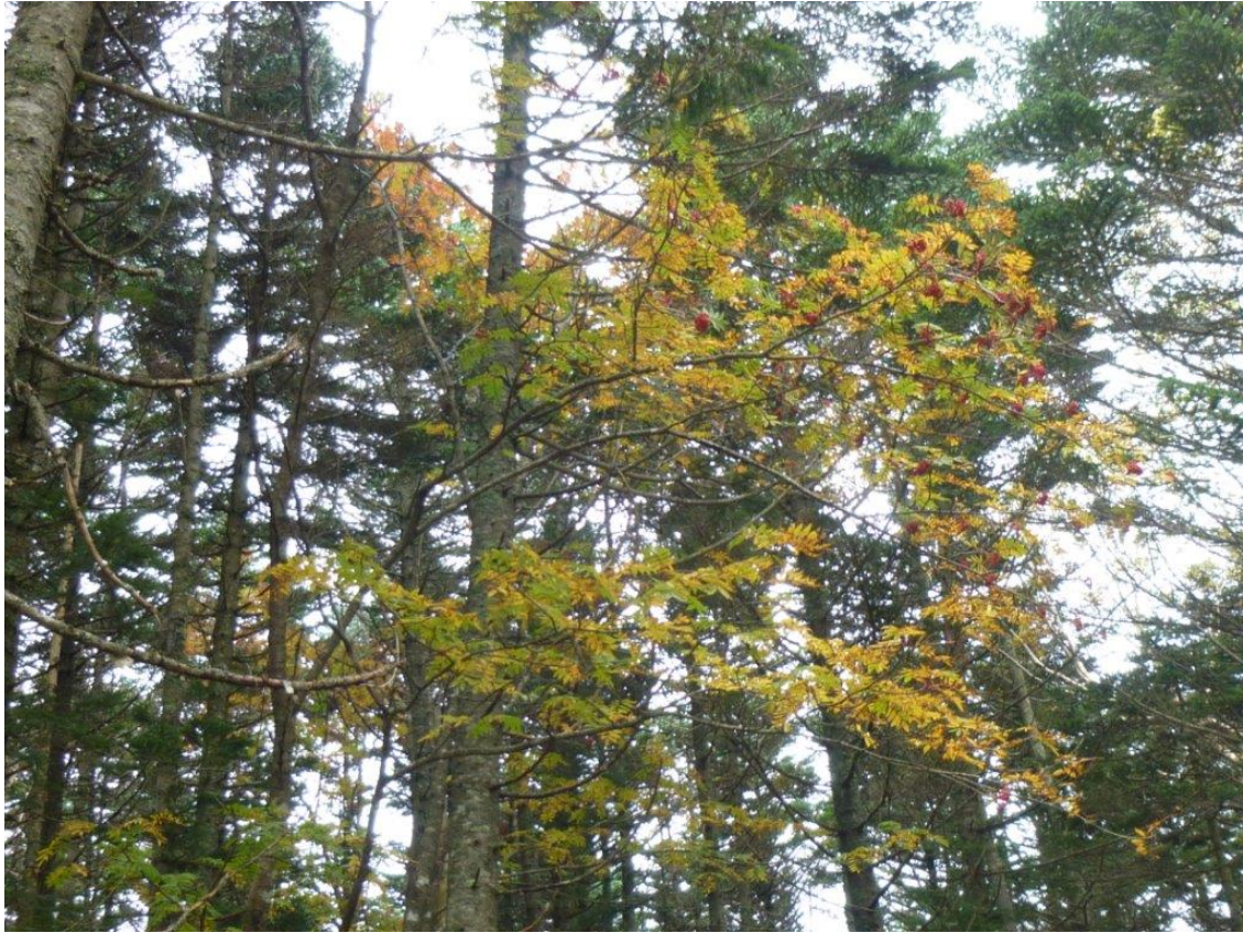
ナナカマドの紅葉