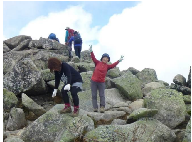
わらびの乙女Iさん