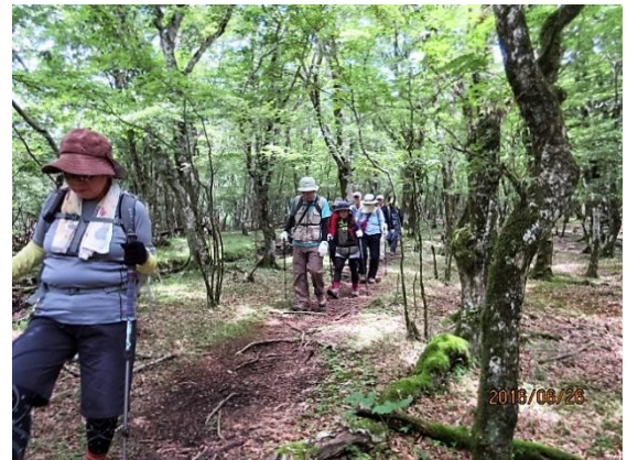
気持ちのいい木漏れ日の中を歩きます