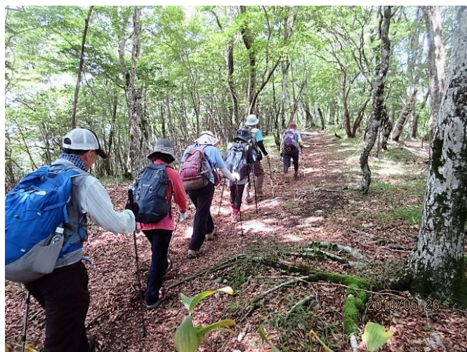
涼しい風で大満足しながらの歩きです