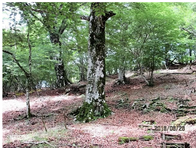
ブナの巨木の林で～す