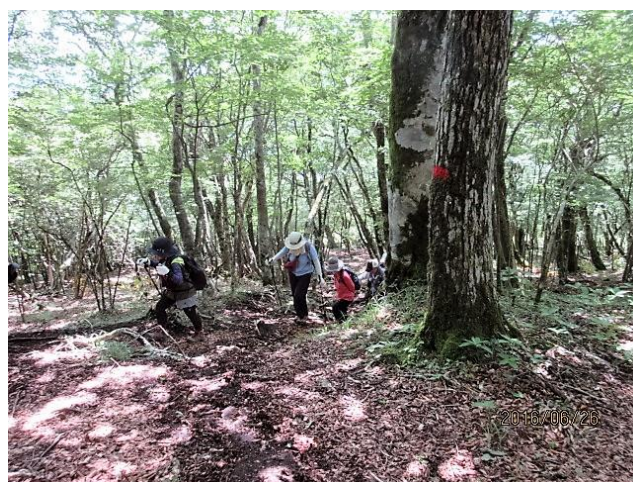
ブナ林が続きます。ブナには癒されます