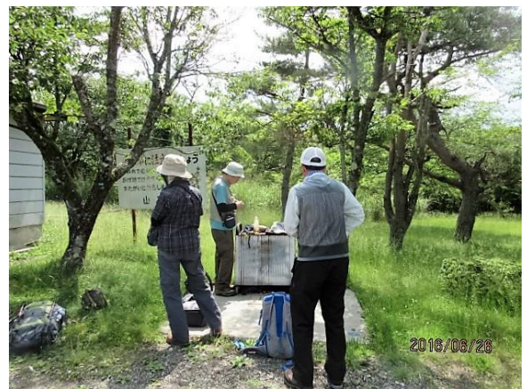
お疲れ様でした。心はビール