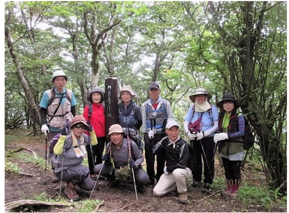
大洞山で集合写真