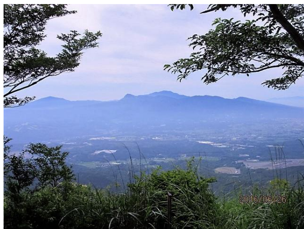
途中で観えた箱根の山々

コース：明神峠（9:10）→三国山（10:43）→大洞山（11:56,12:30）→アザミ平（13:05）→籠坂峠バス停（13:55）