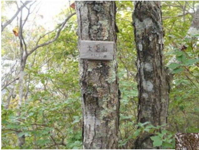
昨日も通った大幡山 昨日は 気がつかなかった 山名表示がありました