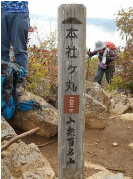
本社ヶ丸山頂 以外と狭い場所です。