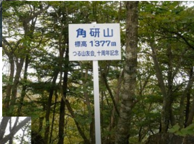
角研山 ここからも笹子駅の行くルートもありますが、今回はもう少し先のヤグラの分岐よりのコースです。