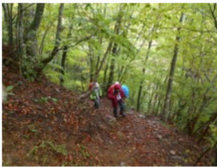
御坂峠です 左は御坂山經由旧御坂峠黒岳方面 右は今回の山行ルートです。

10月8日—10月10日笠ヶ岳に行く予定でしたが一緒に行く仲間の都合により山行が中止の為急遽三つ峠に変更にした。9日は雨の予報だが午後般は雨が上がる予報10日は晴れの予報でしたので出かける事にしました。天下茶屋バス停では小雨でした。