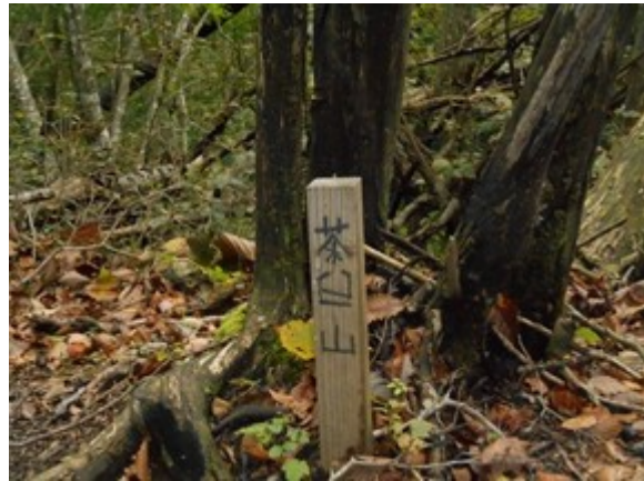
茶臼山に到着 山名標識が手作りです。