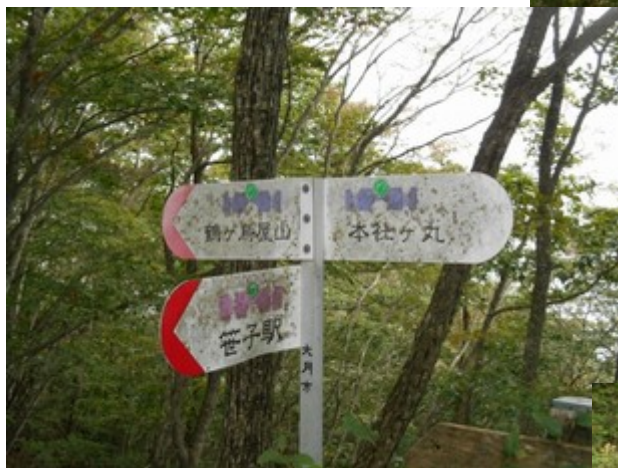
ヤグラの分岐ここから笹子駅に