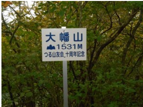
大幡山に到着 このルートはメジャーなのか 山の標識も立派です。