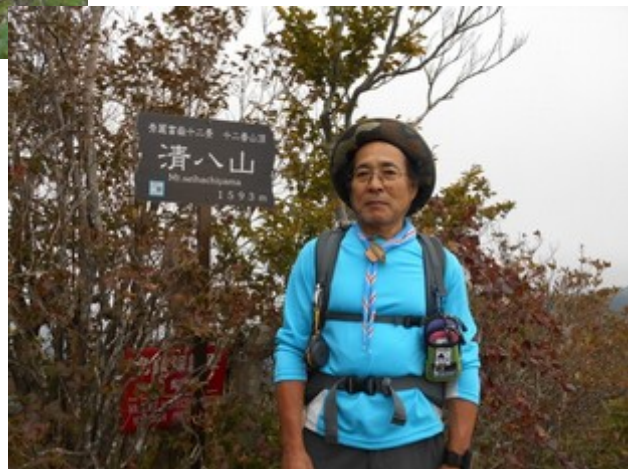
清八山で記念写真