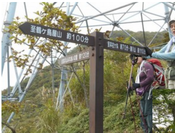
送電線鉄塔で昼食タイム 鉄塔の下が平らで座るのに丁度良い。