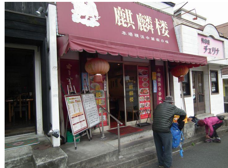
反省会会場前です。これがあるから参加したと！聞こえてきました。