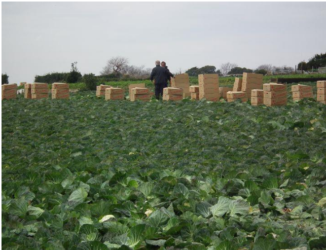
朝とれキャベツ収穫に忙しそう！