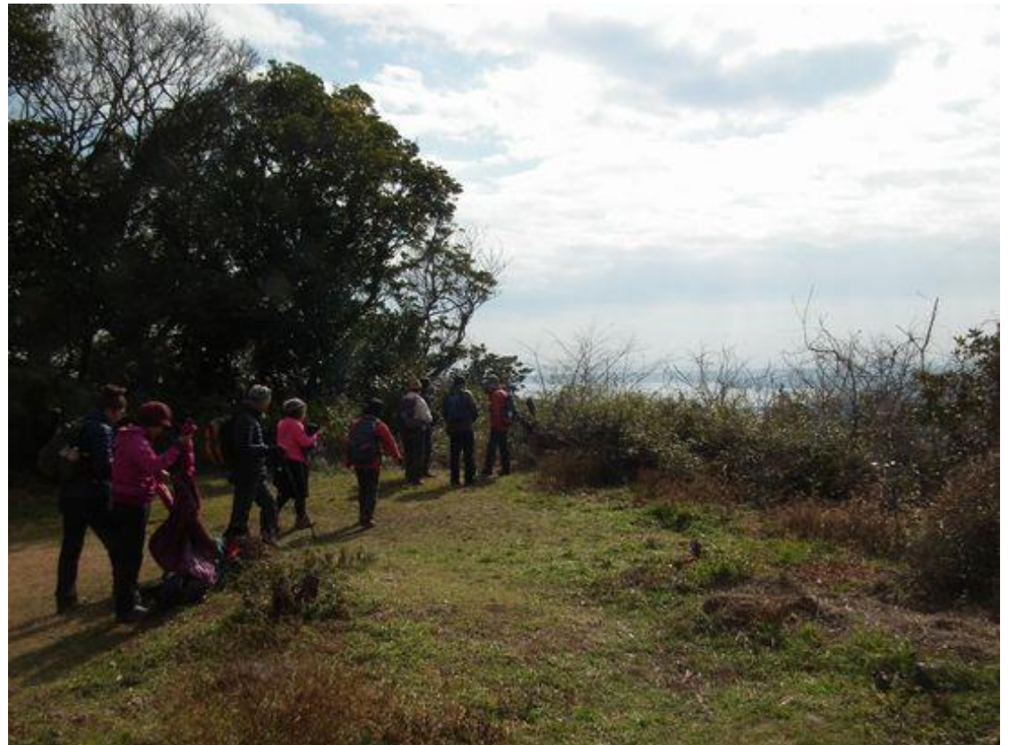
旧日本軍の砲台跡