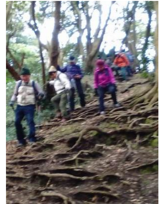
CL 撮影、立体写真ではありません。