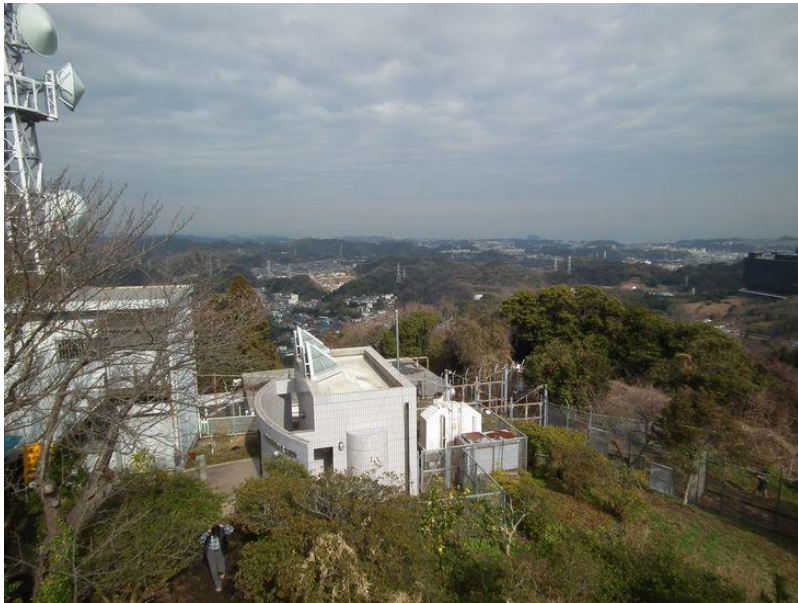
お汁粉の場の上にある展望台より横須賀の街方面