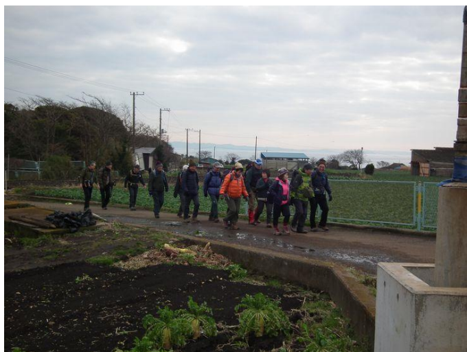
いよいよ展望も開けてきました。