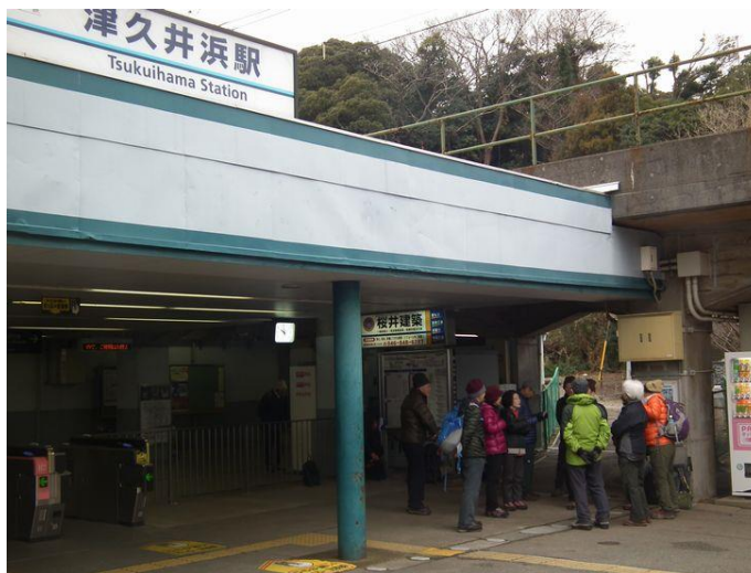
今日は富士山に登るので気合を入れて…

コース：津久井浜駅 10:00…武山入口 10:30…武山 11:09/50…砲台跡 12:23…三浦富士 13:03…三浦霊園 13:43…長沢駅 15:16