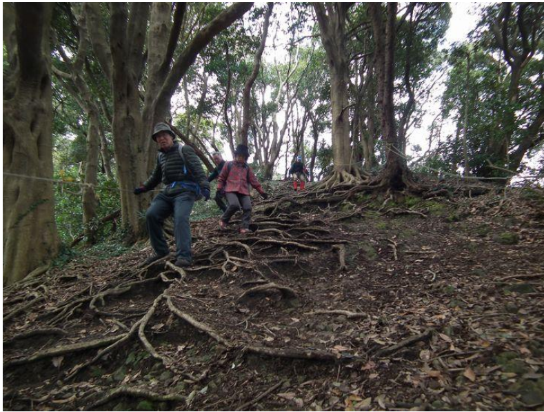
木の根と滑る斜面に気をつけましょう。