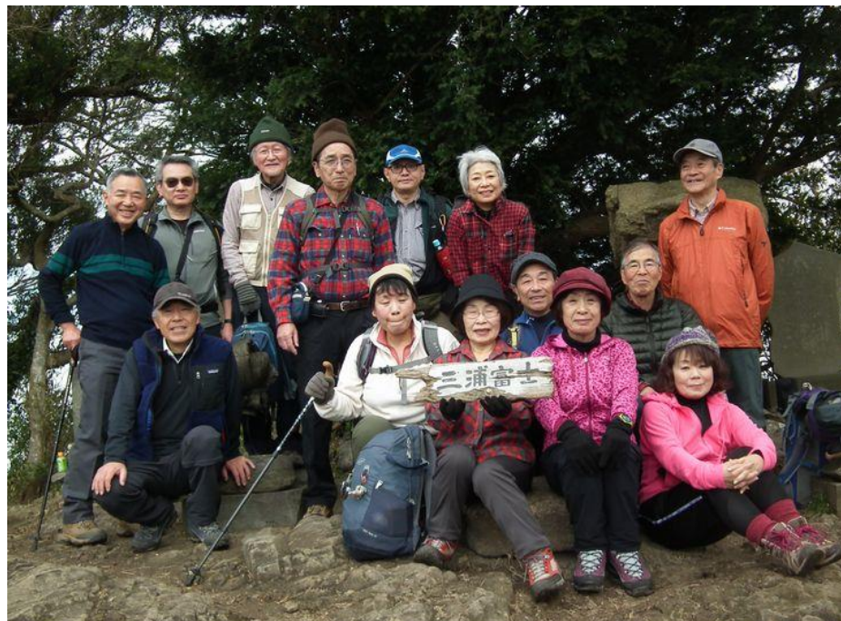
ようやく三浦富士到着しました。 山頂にて記念写真、カメラマン yamaya3 です。