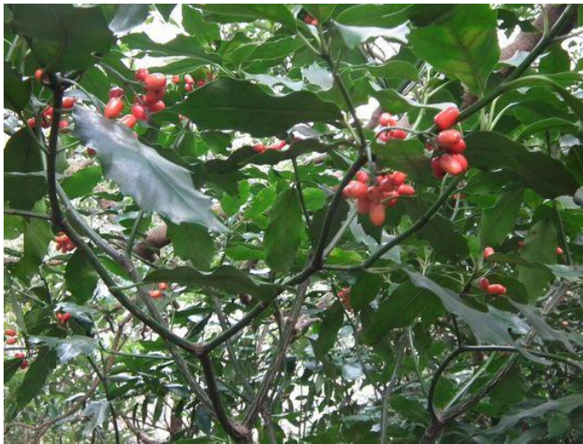
アオキの実 食べられたらいいのにね！ でも、種が大きく実が無いようだから、だめです。