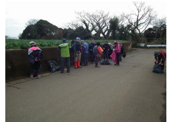
いよいよ本番につき準備です。全部脱がないように！ 近所迷惑です！