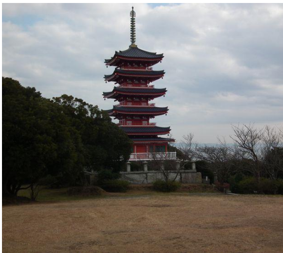
五重塔と大日如来 般若心経を唱えましょう。 良いことがありそうです。