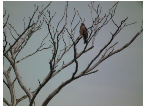
なんだろう？ オオタカ、トンビ？ 貴重な動物のオオタカも経済最優先につき保護から外されるそうだ。