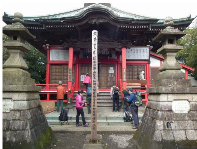
お賽銭投入の方だけご利益あり