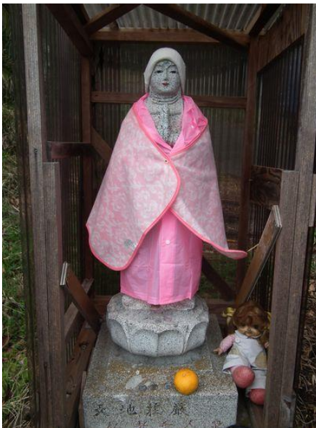
参加者のお姉さんより若々しいお地蔵さん、今はやりの紅！ さあ早く帰ろう