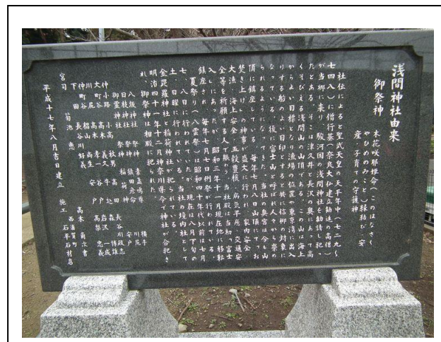
駅裏にある浅間神社 無事に歩けますように “よろしく” お願いします！