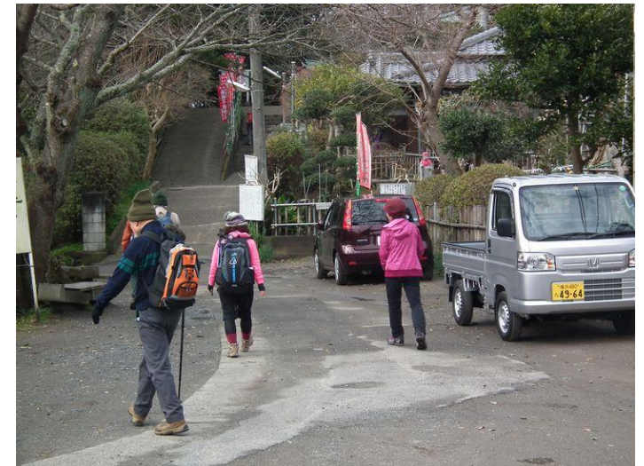
武山不動到着、とりあえず無信心ながら手を合わせよう！