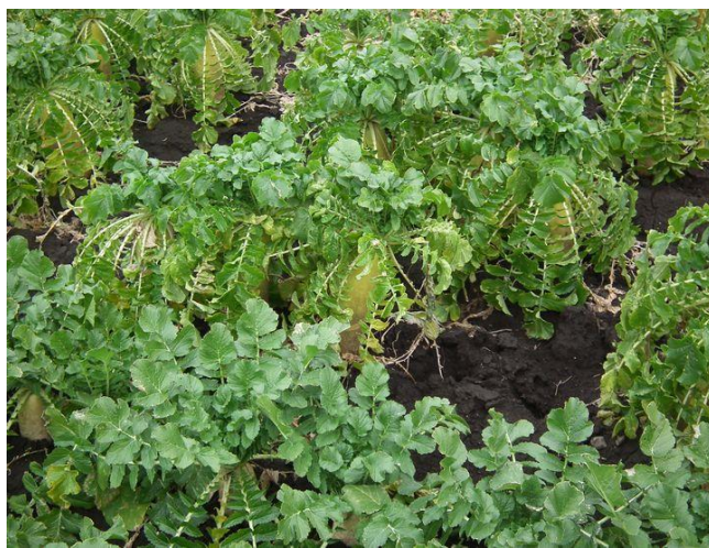
一面大根キャベツ畑、夕飯はふるふき大根と…