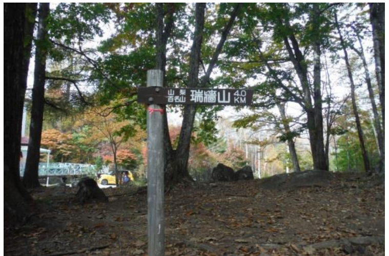
小屋近くの紅葉。優しい色合いに変化した林。

八王子7：29分発スーパーあずさ利用で荊崎に向かう。あずさ自由席の乗車率180%荊崎駅でも臨時バスができるほどの混みようで深田公園行の登山客と瑞牆山荘行の登山客が別れてバスに乗る。瑞牆山荘前の紅葉。山荘前で身支度を整え各自ストレッチの上出発する。この時点で予定より7分遅れ。瑞牆山まで4キロの標識確認。