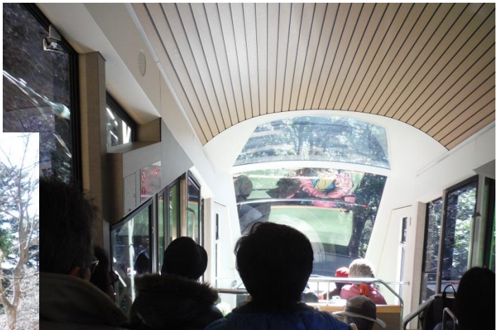
夫婦杉付近でアイゼンを付ける。