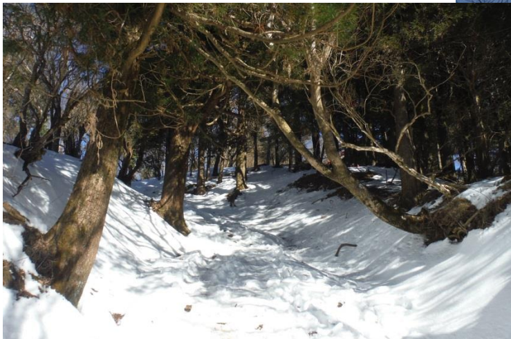
富士見台から先は雪の道。今年初めての雪道に心が踊る。