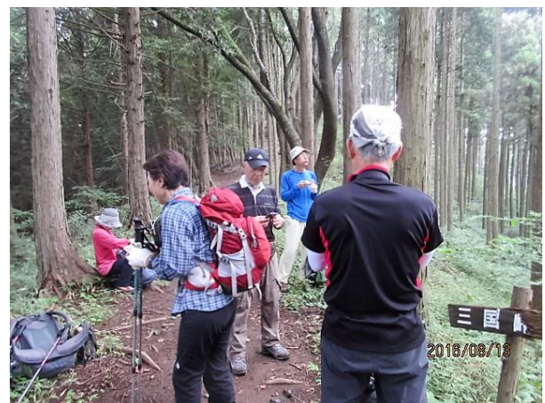
鎌沢への分岐で一休み