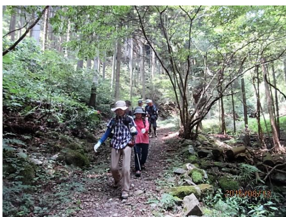
涼しかった山ともお別れです