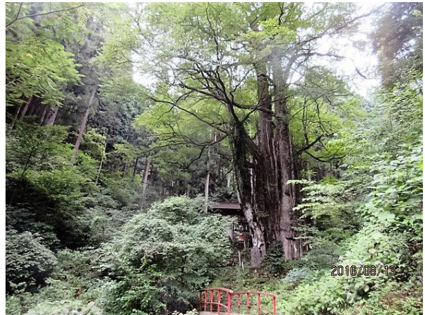
カヤの巨木も元気です