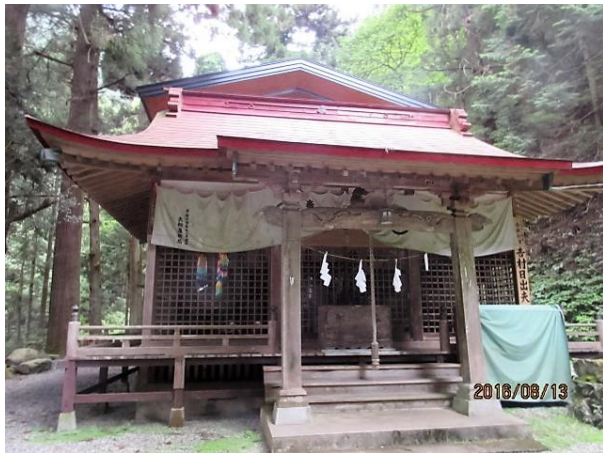
古さと威厳を感じさせる軍刀利神社

コース：軍刀利神社下(8:05)→カヤの巨木(8:25)→鎌沢への分岐(9:14)→三国山(9:40) →生藤山(10:00)→連行峰(10:40,11:20)→和田バス停(12:50)