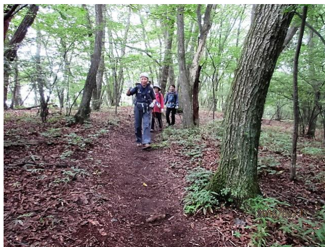
開けた雑木林を気持ちよく歩きます