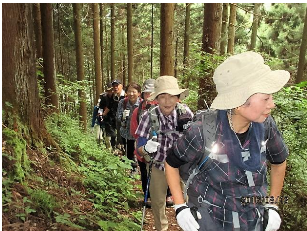
涼しいながらも汗だくで登ります