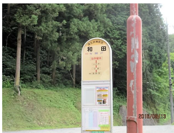
最終地点・和田バス停