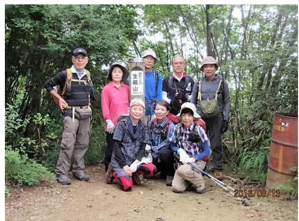
生藤山に着きました