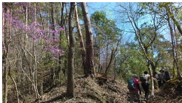
ツツジも迎えてくれました