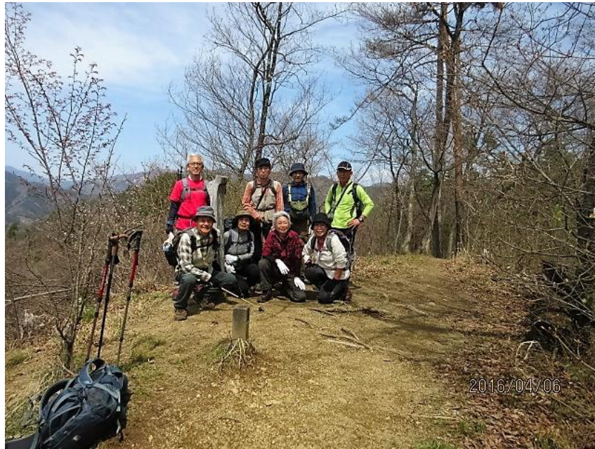
穏やかな春のぬくもりの中での集合写真です。