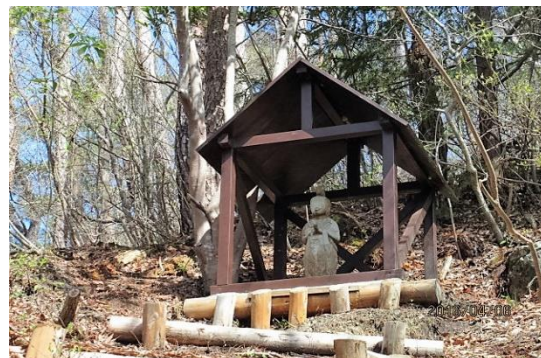
享保年間の馬頭観音