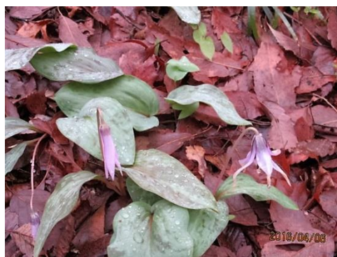
けなげに咲くカタクリ