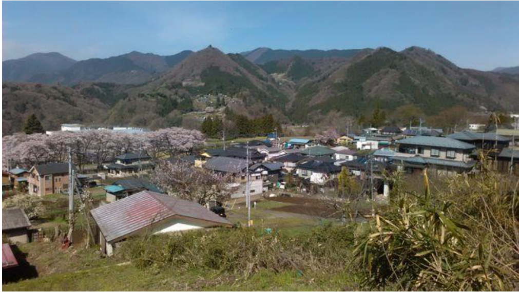
山風呂より要害山（中央）と権現山から雨降山の山並