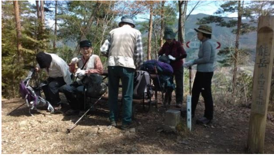
能岳山頂、Iさん持参の酒饅頭をご馳走になる