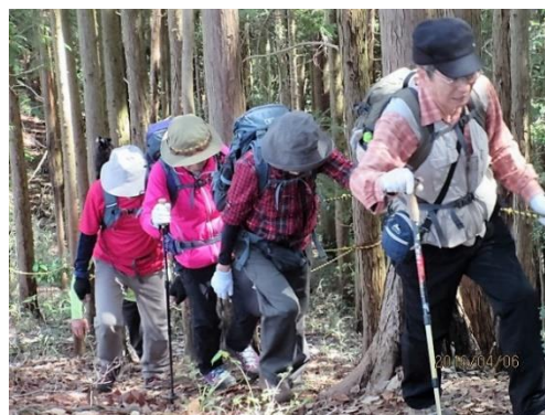
急登もなんのその