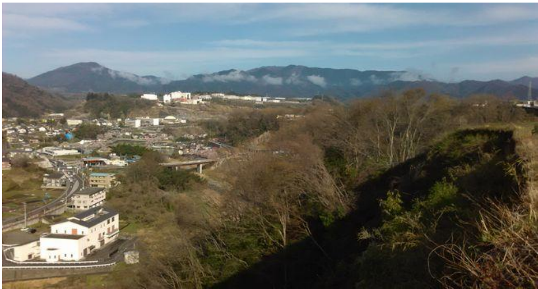
上野原市街から扇山と権現山