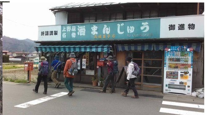
下山後に予約しておいた酒饅買いました。