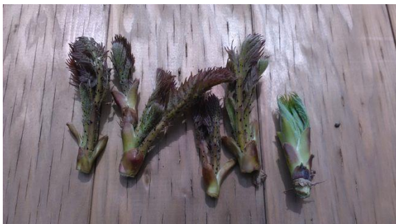
本日の収穫 タラの芽 4 本、ハリギリ 1 本