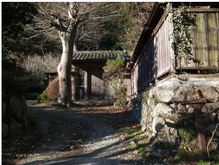
山梨の学問所だった甲府徹典館から移設した門

コース：中山 6:40—高尾 7:46—上野原 8:08/30—尾続 8:46/55…尾続山 9:33…実成山 10:05…コヤシロ山 10:14/21…風の神様 10:41…常夜灯 11:05… 要害山 11:10/12:00…鏡渡橋 12:27…新井 12:40/13:12—上野原 同行者：1名