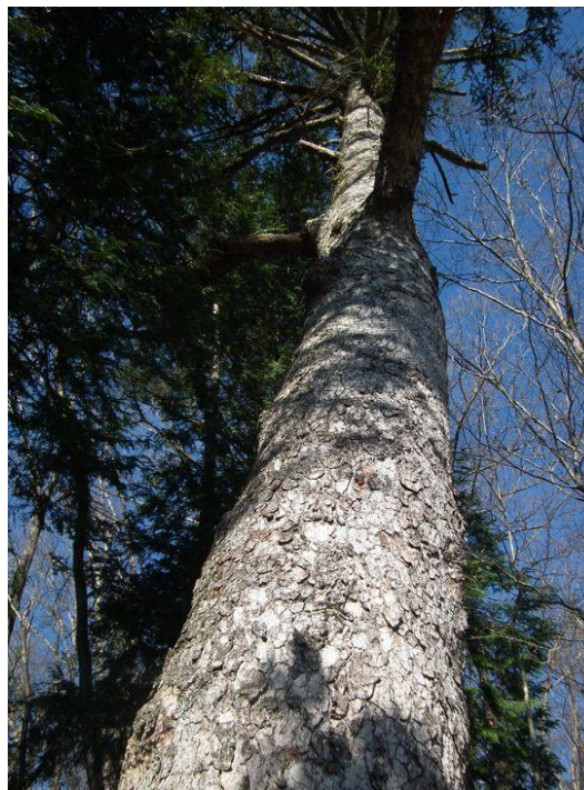
この一帯の山には大きな縦ノ木がある

2016年最初の山歩き 足慣らしのため手頃な上野原へ、 昨年5月にもやってきた要害山への里 山歩き、尾続バス停で下車したのは3 人のみ、どうやら静かな山歩きが出来 そうだ。