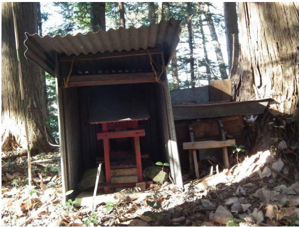
登下（とっけ）と大倉の集落を結ぶ峠にある祠