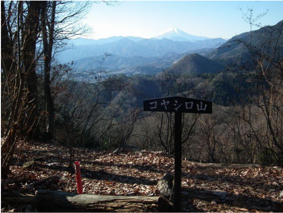
雨降山への分岐になるコヤシロ山