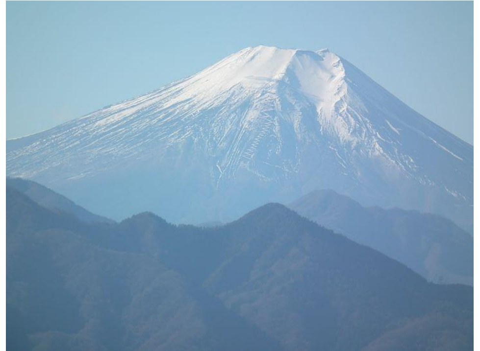
実成山付近からの富士山