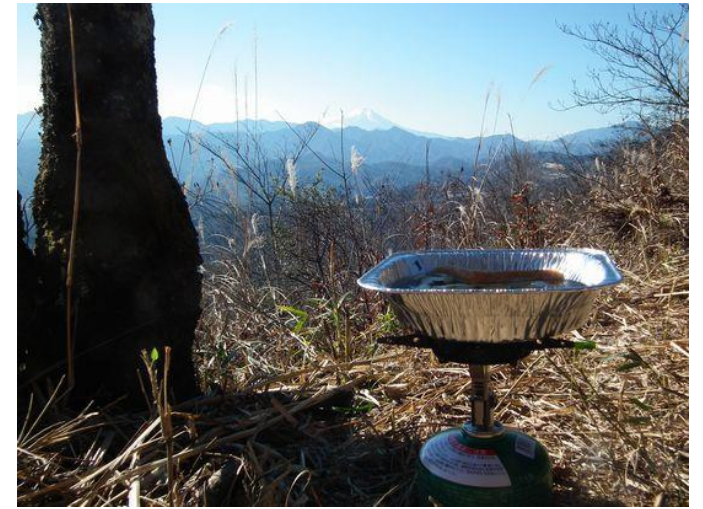
要害山にて鍋焼きうどんと富士