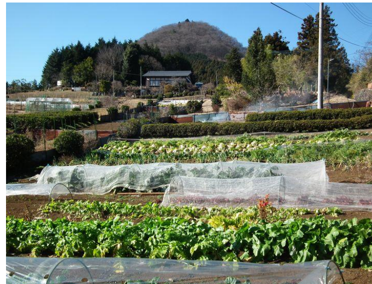
要害山麓小倉より