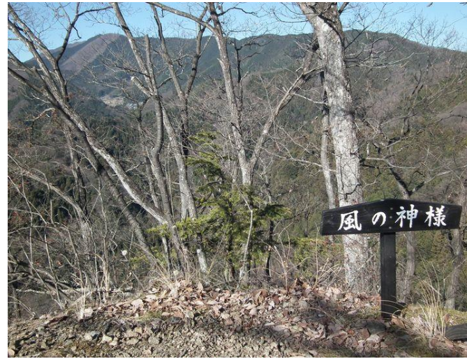
雨降山から権現山の山並