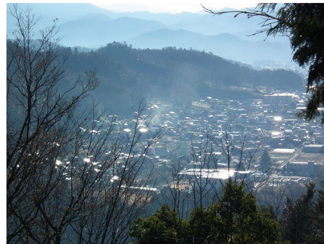
尾続山近くの展望箇所より上野原の街展望