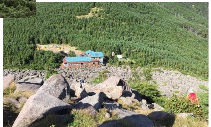
青年小屋では第 18 回目夏の終わりコンサートが 開催され、ソピラノ歌手含め6名で1時間演奏