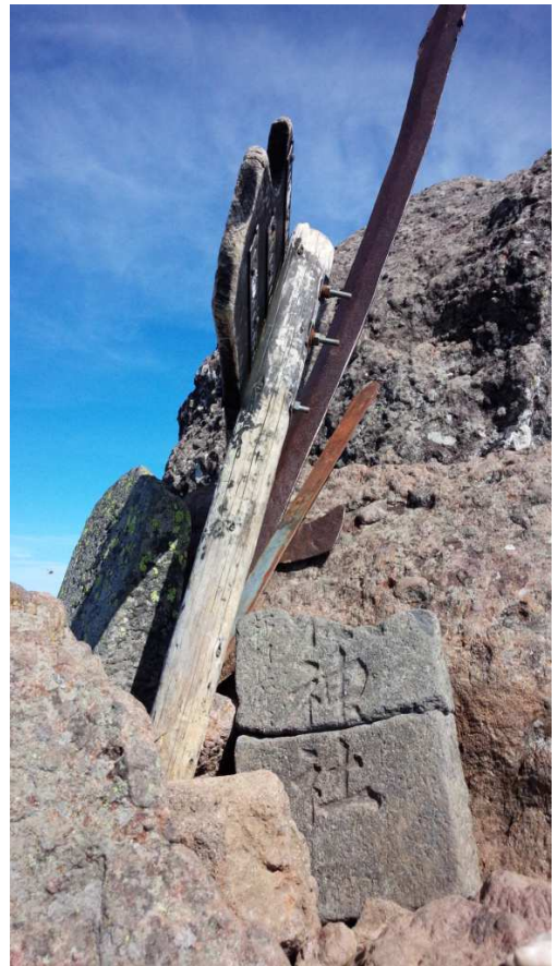
赤岳に手が届くような距離感