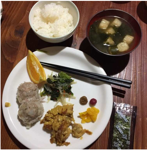
青年小屋 オーナー 夫人 手作りの 柔らか 焼売で 朝食