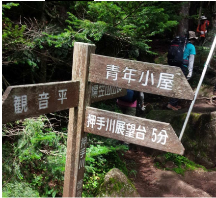
観音平駐車場は 10時で満車状態

27日 6:50ー権現岳ー三ツ頭/11:00ー木戸口ー観音平/14:35ー小淵沢/15:25