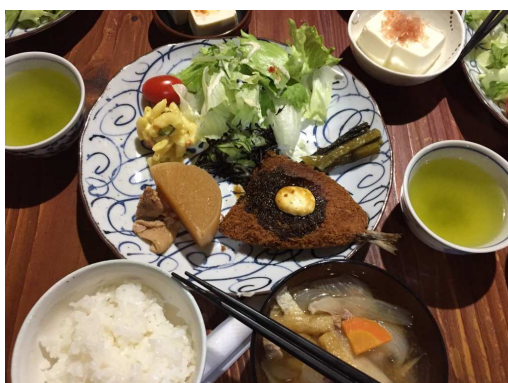
待望の夕食 揚げ立てアジフライ 巨峰と シャインマスカット 各3個 のデザート付き 他ボリューム満杯