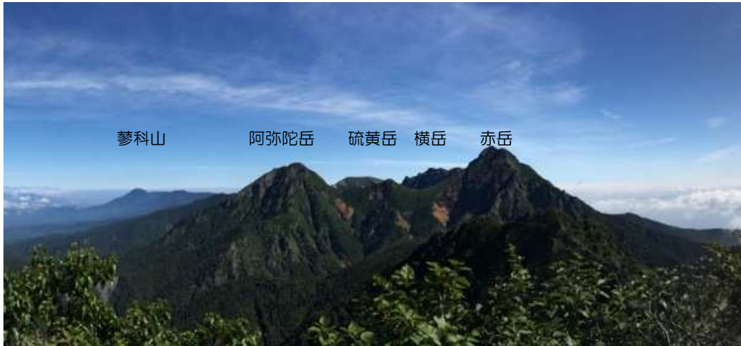
蓼科山 阿弥陀岳 硫黄岳 横岳 赤岳