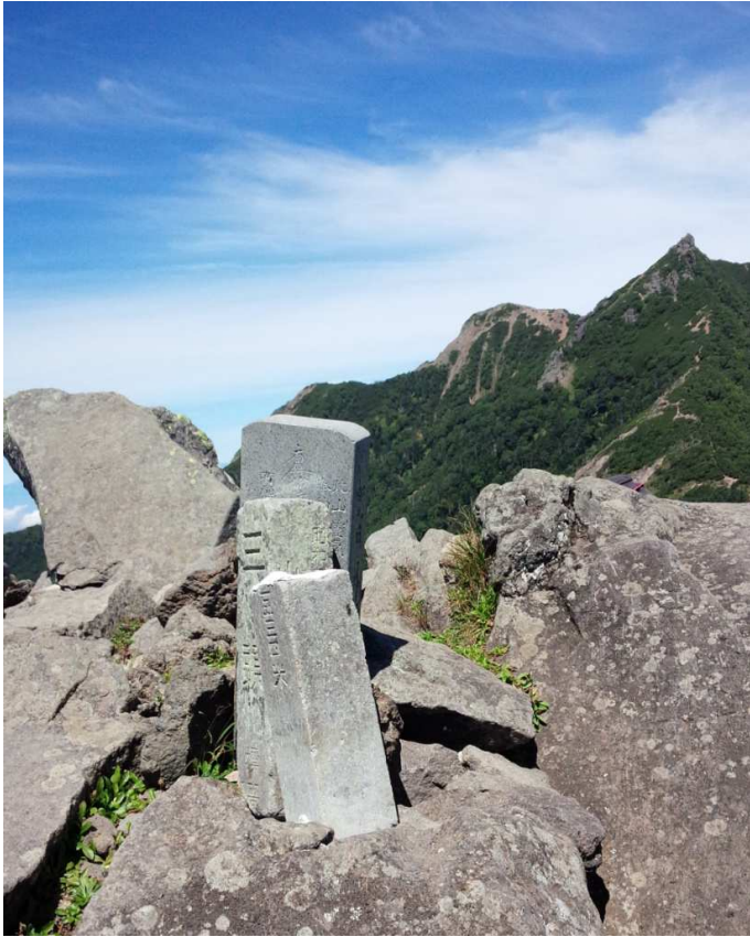
三ツ頭から権現岳を振り返る