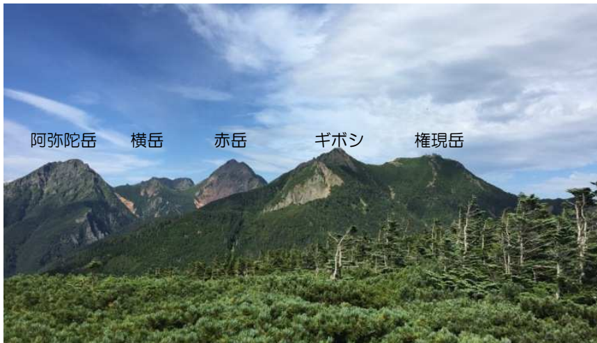
好天にてテント場も一杯