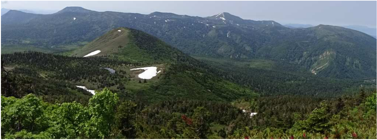
南八甲田山方面のロケーション