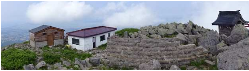
津軽平野のロケーション 遠くには青森湾