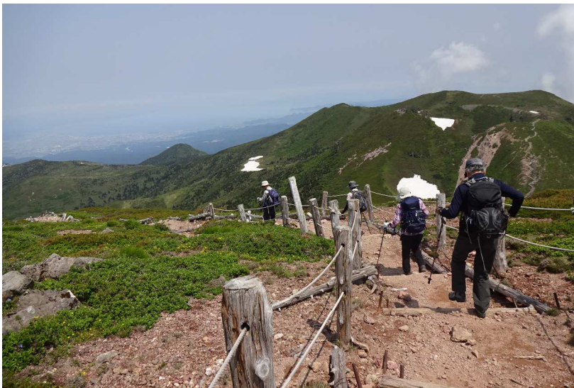
毛無岱に向けて下山開始