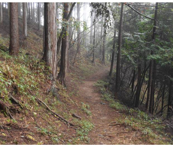
六木峠から横手峠への登山道