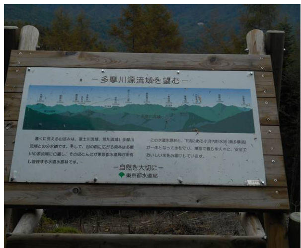
多摩川源流域の標識