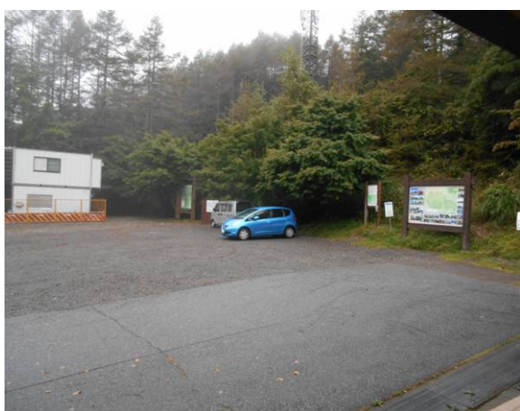
柳沢峠の駐車場 写真撮影の場所がトイレ

柳沢峠に着いたのは、7:20分で、小雨が降っていた、天気予報では9:00位に雨が上がるとの情報があるので、車で雨の上がるのを待った、峠の駐車場にはトイレもあり山行の準備の場所としては最適な場所です、8:30分位になると薄日もでて来たので、出発準備に取り掛かった、登山口は駐車場の反対側に階段がありそこが登山口です。今回の山はハイキングコースでした、展望台より横手峠までの間、尾根のルートを通りました。