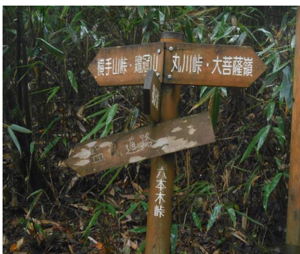
六木峠 ここから丸川峠経由 大菩薩嶺に行けます、ここで 鶏冠山の表示が出てきます。