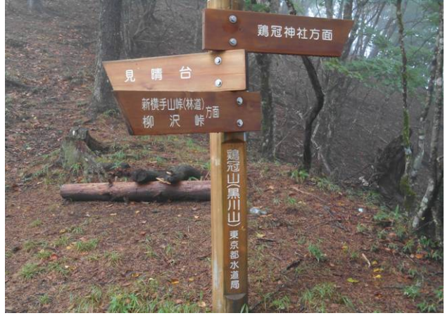
黒川鶏冠山の山頂 ここから5m位の場所に三角点があった