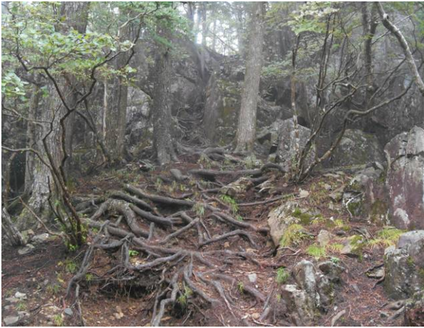
鶏冠神社に向かう、この上が神社と思われたが何もなかった