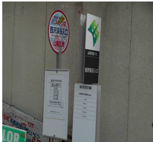
西沢溪谷バス停 塩山行きは日に4本