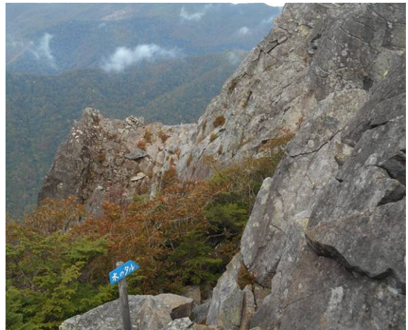
下りも岩場が続く