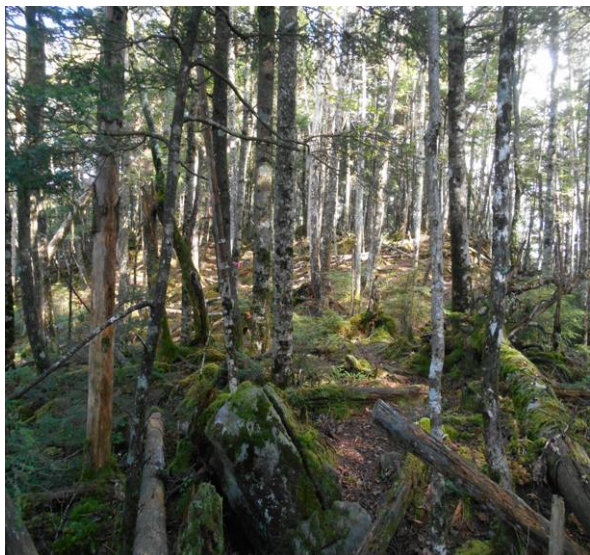
黒金山への登山道 踏み後は少ないですが目印のピンクテープは多くあります。