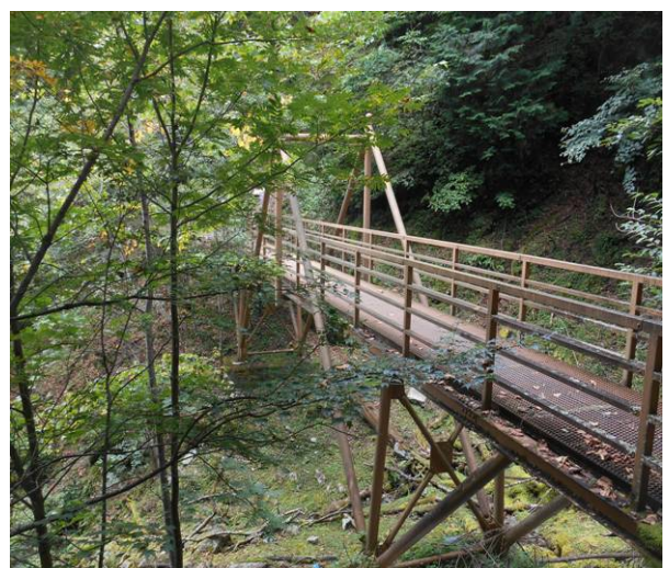
沢ぐるみ沢の橋脚