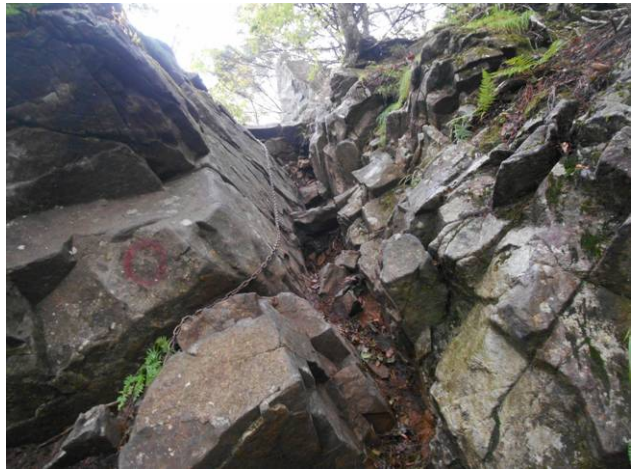
途中から鎖場が出てきます。