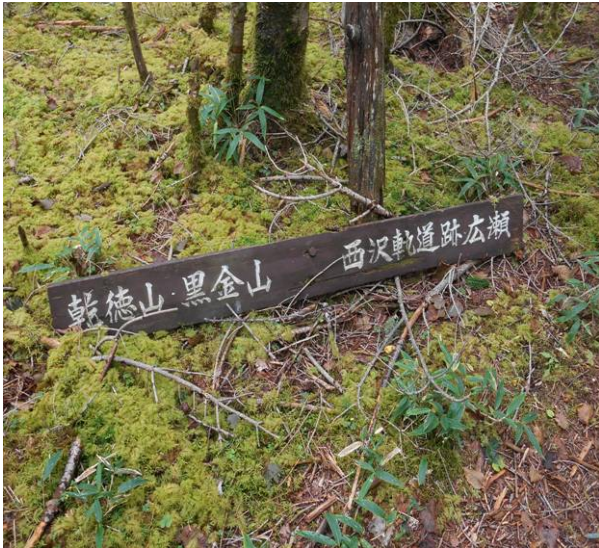
古い標識 西沢軌道広瀬（地区の名前）