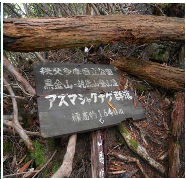
ここは国立公園でアズマシクナゲ群生地