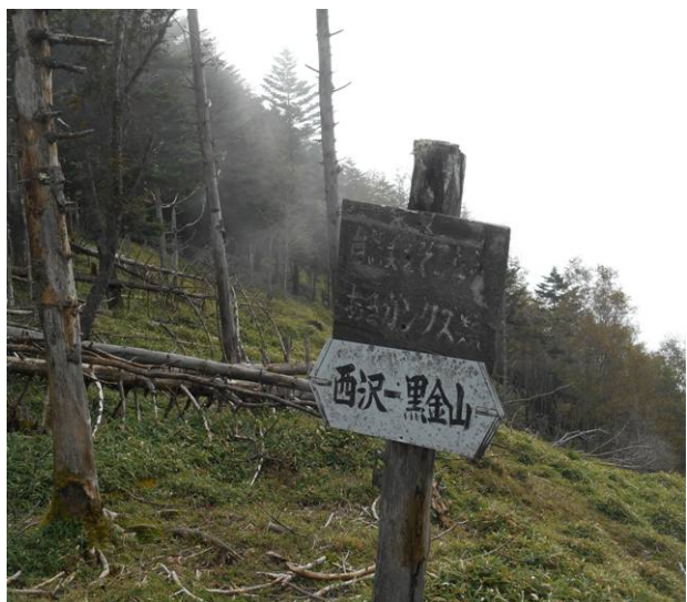
牛首に到着 黒金山からは急下降で表示では20分の表示でしたが 約30分掛かった