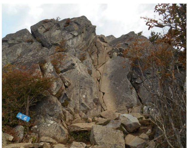
山頂直前最後の鎖場 乾徳山で有名な鎖場 腕力が無いと登るのが大変