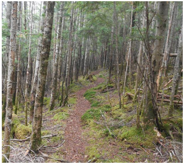
ここまで来ると登山道もはっきり見える