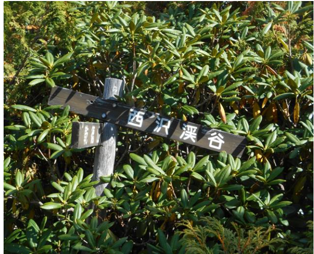
ここまで来て初めて西沢溪谷の表示