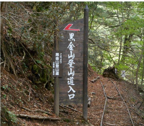
西沢溪谷からの登山