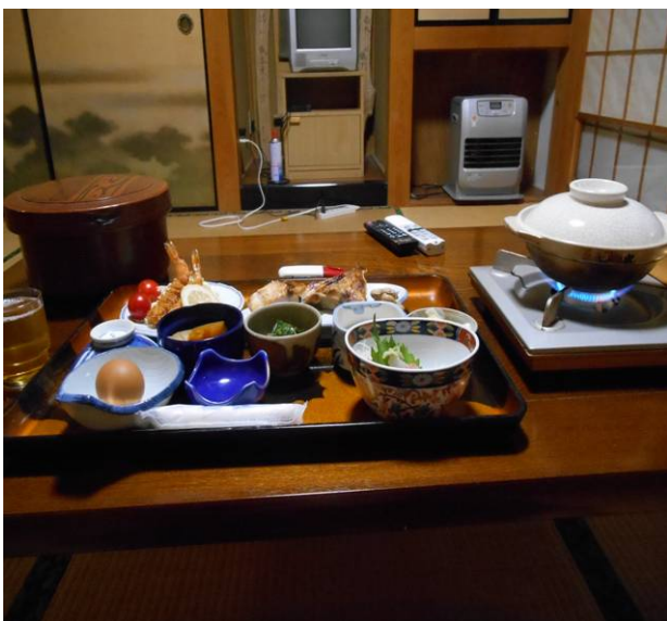
民宿の夕飯 豪華です 料金¥6700でした