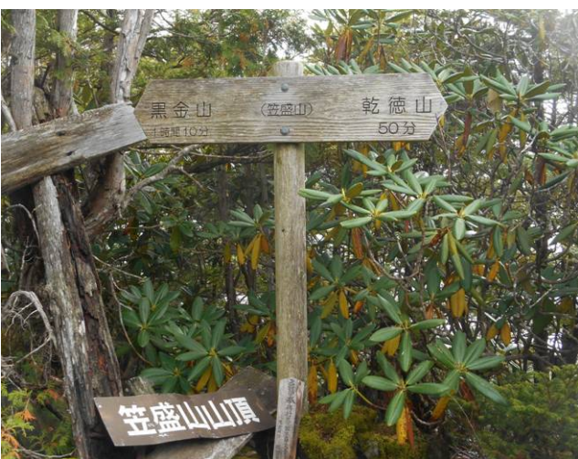
笠盛山山頂 黒金山まで1時間10分の表示