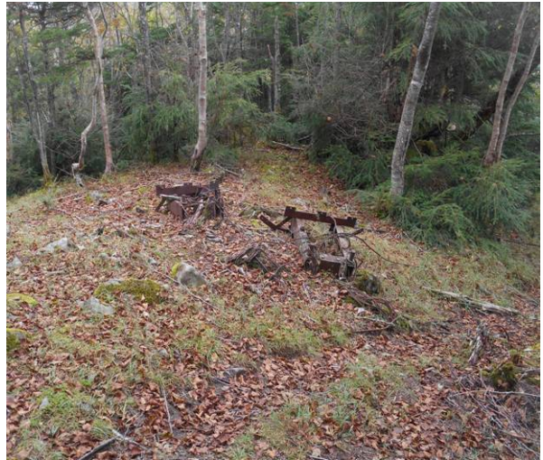
途中に林業で使用していた機械の残骸