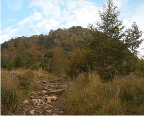
正面が乾徳山そんない急な山には見えない？