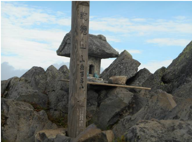
乾徳山 山頂かなり狭い