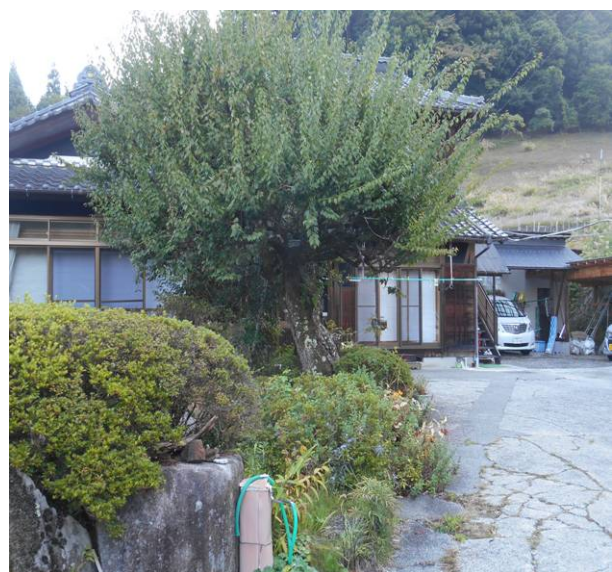
お世話になった 日の出荘です。