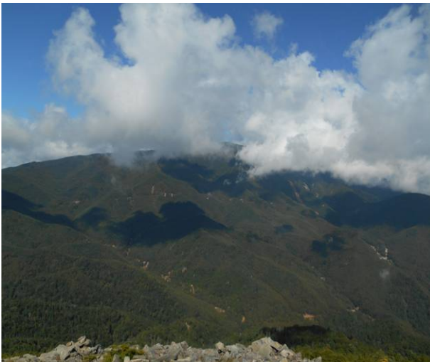
黒金山山頂よりの展望