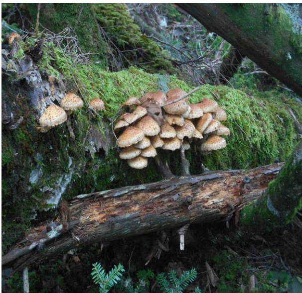
大量のキノコ食べられる物なら大量です