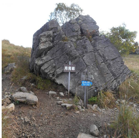
月見岩 扇平はこの先