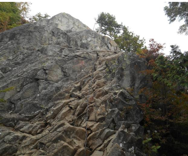
次の鎖場です 先程よりは長い