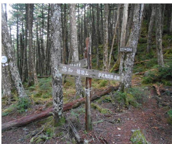
大ダオ分岐 このコースは不明