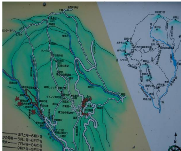
今日歩くルートが表示但し黒金山までしか表示されていない。