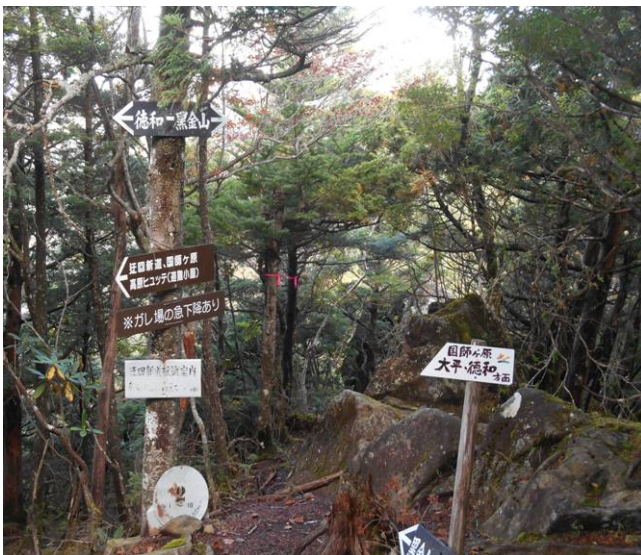
乾徳山下山コースの分岐点コースはガレ場の急下降ありの注記表示ありどちらにしても下山には注意が必要