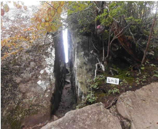
剃刀岩 間は通り抜け出来ない？ 私はリックが大きいので行きませんでした