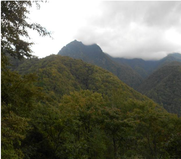
大展望台より 明日登る甲武信岳方面