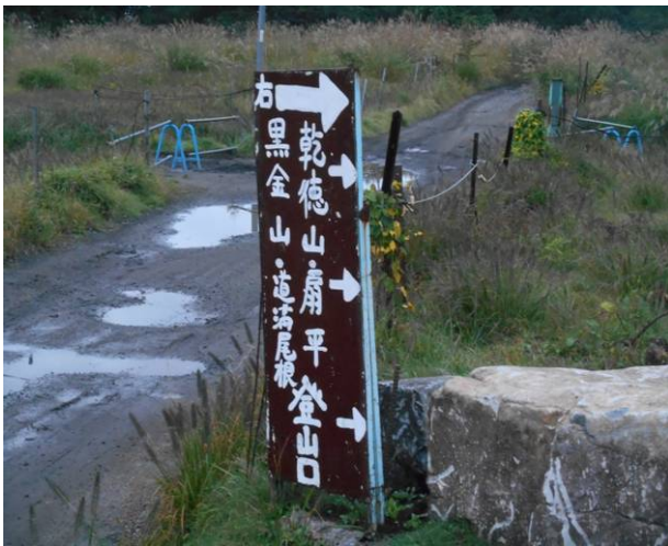
登山口今回はタクシーなのでここで降りたが車の場合は約500m位手前が駐車場です。

朝5:30分に乾徳山登山口に、まだ辺りは少し暗いが、電灯は必要ない、これから乾徳山－黒金山－西沢溪谷に、この日のコースタイムは9時間以上先ずは、乾徳山を目指して出発した。