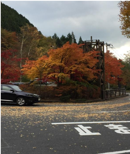
都民の森バス停前にて ここのもみじの色づきが最高でした