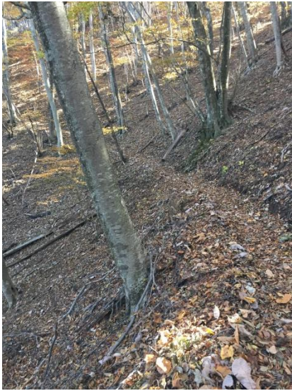
木漏れ日の山道を行く