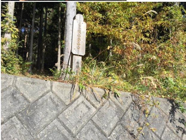
鶴峠の三頭山登山口