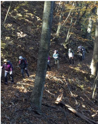
標高 1200M は紅葉真っ盛り