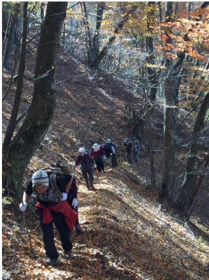
落ち葉をサクサク踏み分け三頭山へ