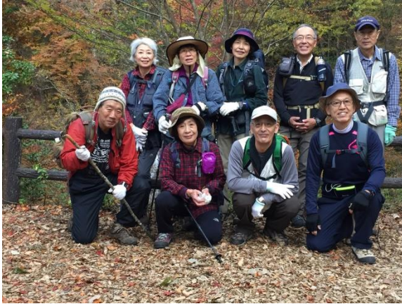
紅葉の三頭大滝前にて