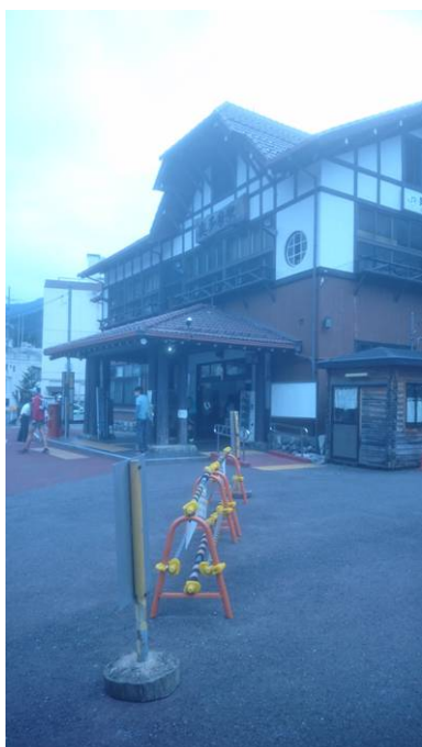
奥多摩駅 少し雨が降り始めた

台風18号の影響で雨の予報で出掛けた、奥多摩駅ですこし雨がふってきたが愛宕神社入り口で、雨が上がった、