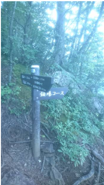
このコースは鎖を迂回するルートもあります。