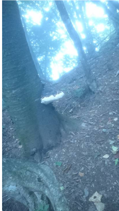
木に大きなキノコがありました