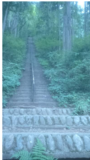
神社前の急な階段