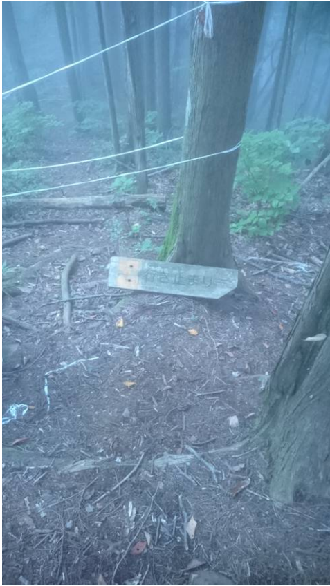
天地山分岐点 行き止まりの表示 ここから入って行きま