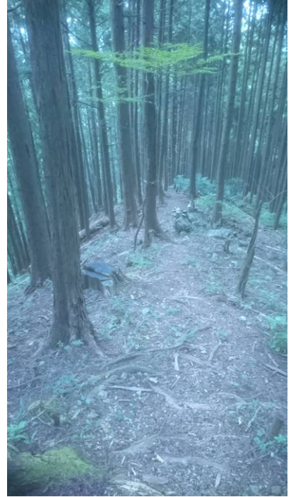
登りは岩山でしたが下りは急な土の道です。