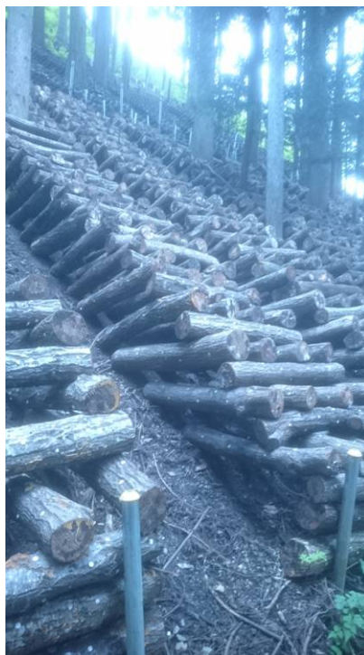
キノコ木の原木が一面に