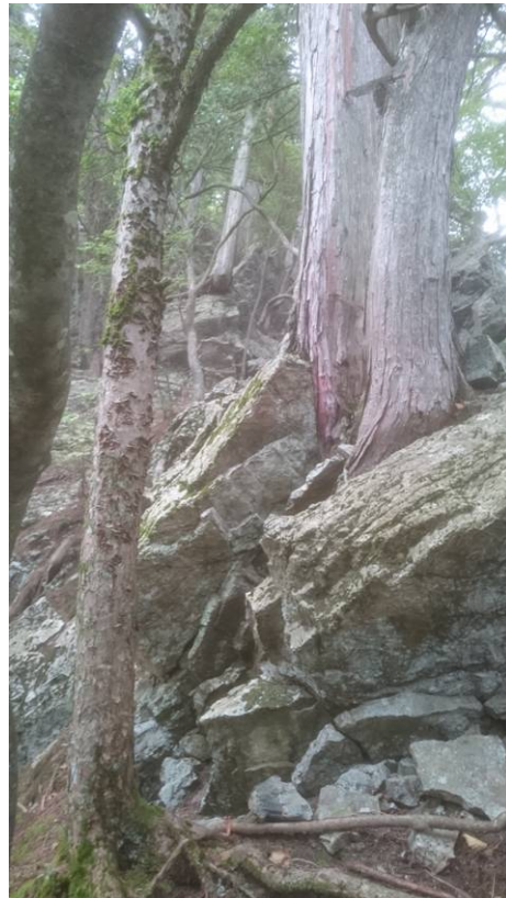
天地山山頂付近は岩山で急な登り 途中にロープが数箇所ある。