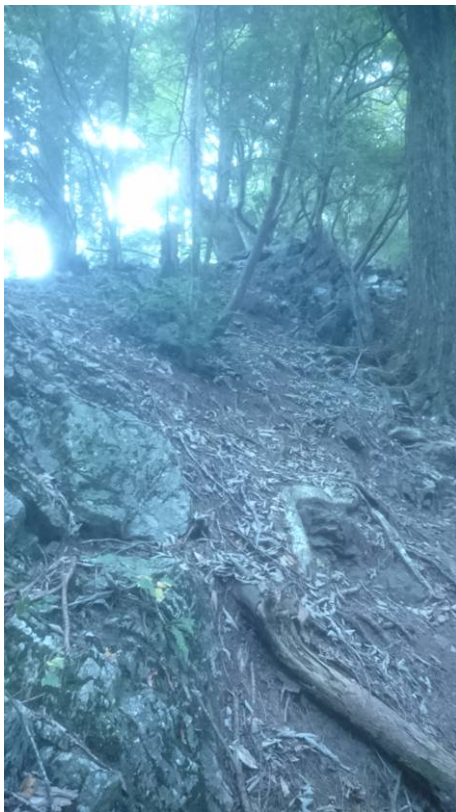
途中に細尾根の箇所があります。