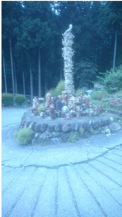
途中に施設があり焼き物が飾ってあった