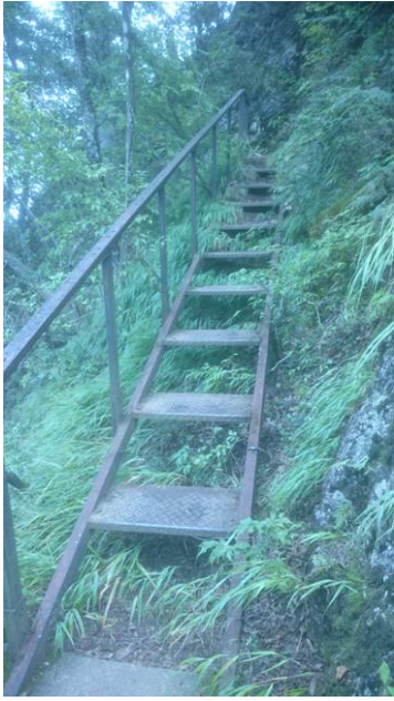
途中に梯子がありました。