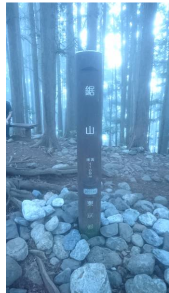
鋸山山頂 ベンチが数個あります。