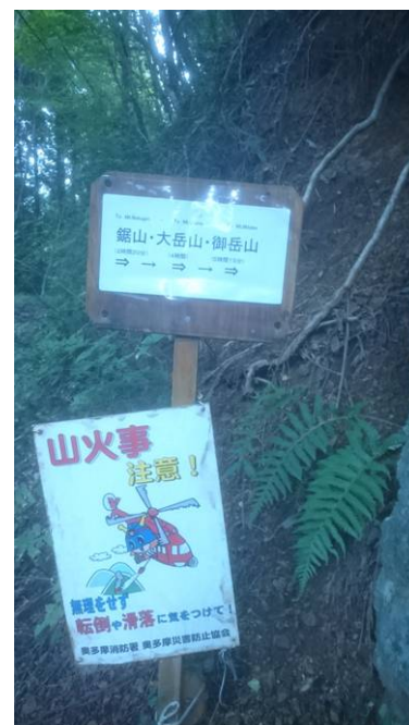
鋸山=2時間20分の表示