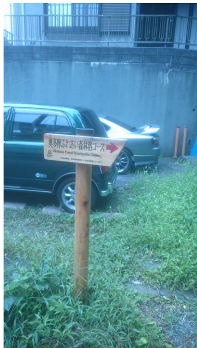
鋸山コースの標識