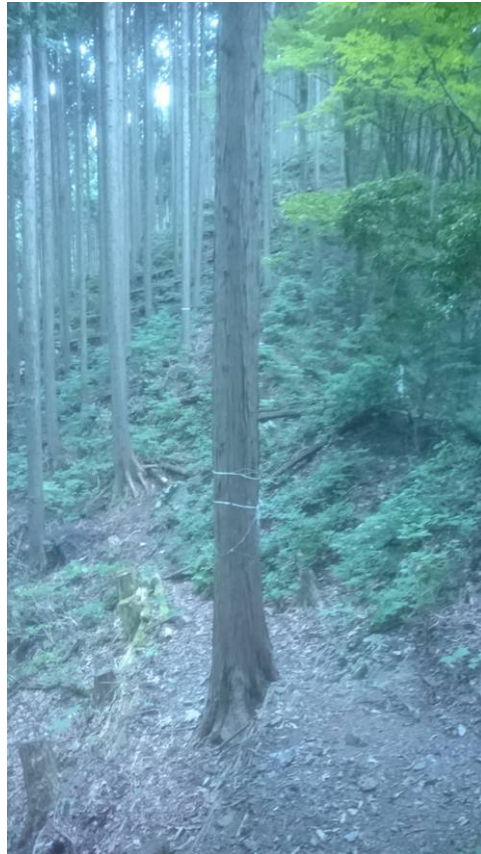
人口林の中の作業道標識は無