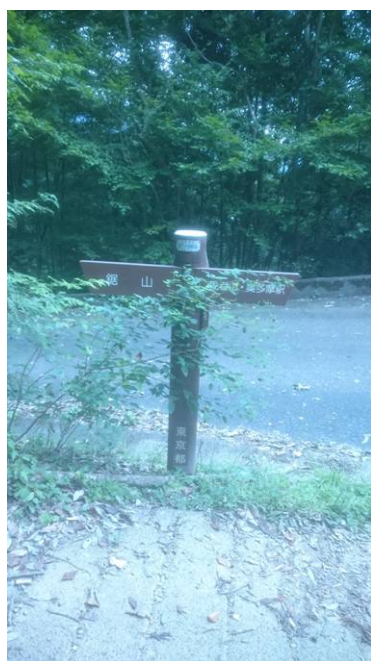
神社裏側に駐車場があった