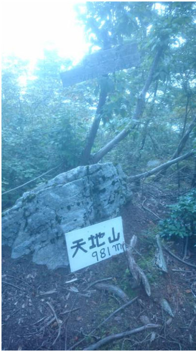
天地山山頂 ここから唯一の展望があるのですが今日は雲で見えませんが、