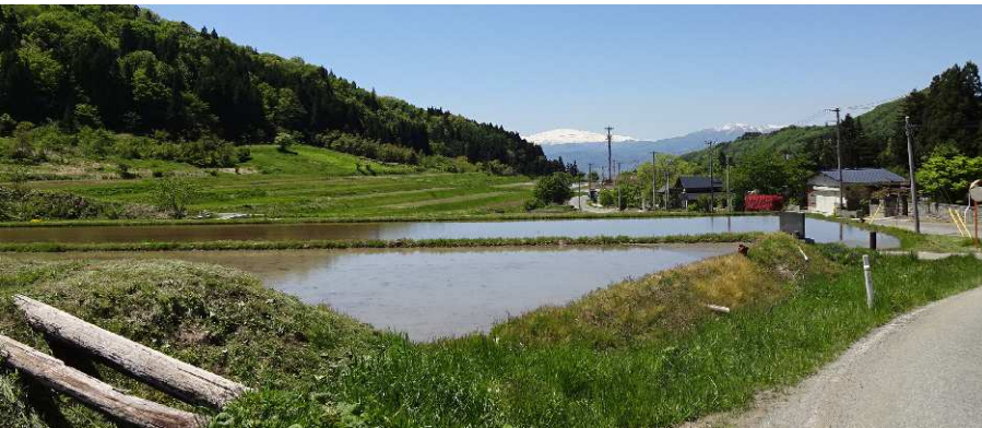
天童市郊外田麦野集落の 棚田 明日は田植えの予定