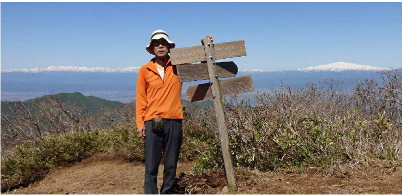
田麦野集落、天童市内、月山