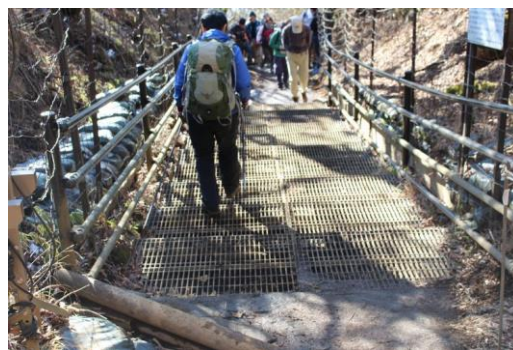
登山道にあるグルーチングという設備、 鹿柵と同じ役目だそうです。 これは犬もいやがります。