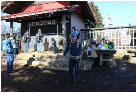
神社に背を向けて！