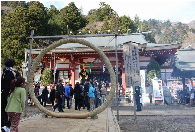
輪くぐりです。 いつまでも歩けるように願いました。 僅かなお費銭で！