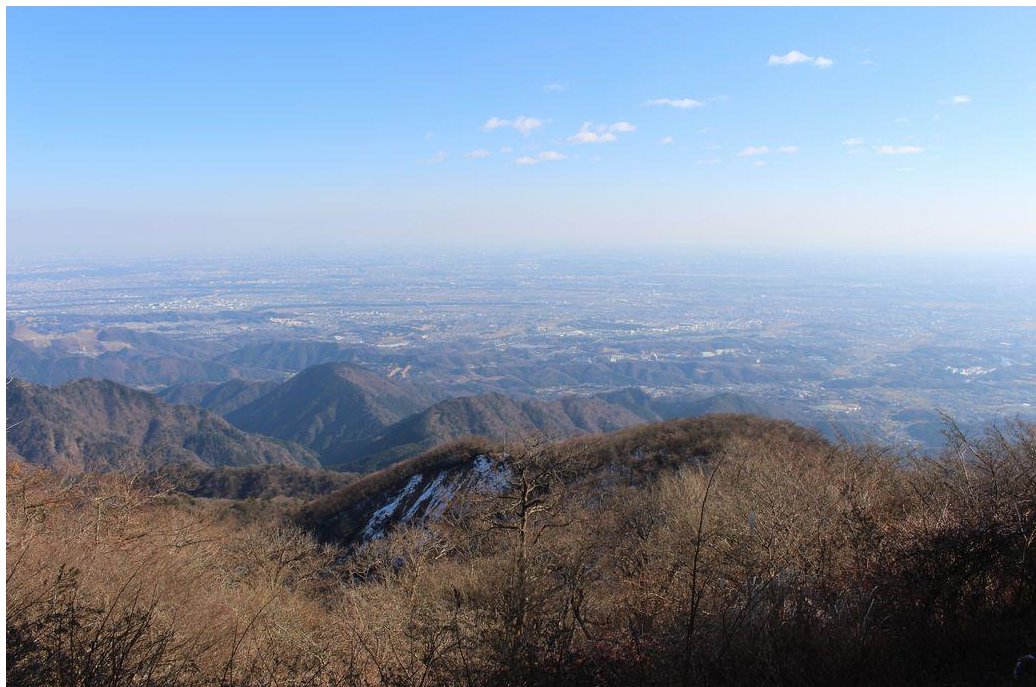
横浜方面の眺めですが、春霞のような、スモックのようなものではっきり見えません。