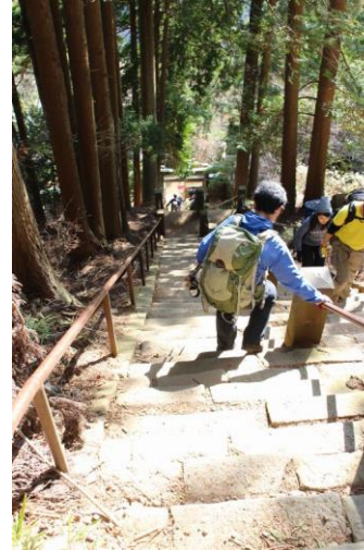
下社への石段、急です、 年よりは手すり利用が安全です。