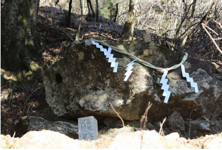
天狗の鼻突き岩 左下に穴があります。