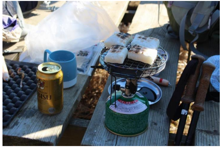
お正月ということでビールとお餅で満たす。