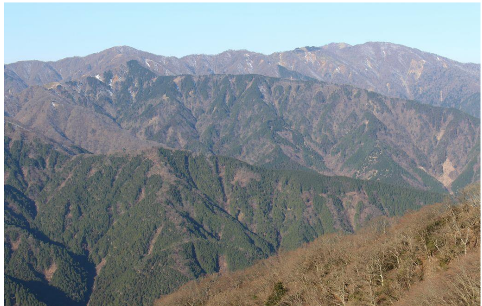
塔の岳から丹沢 連山