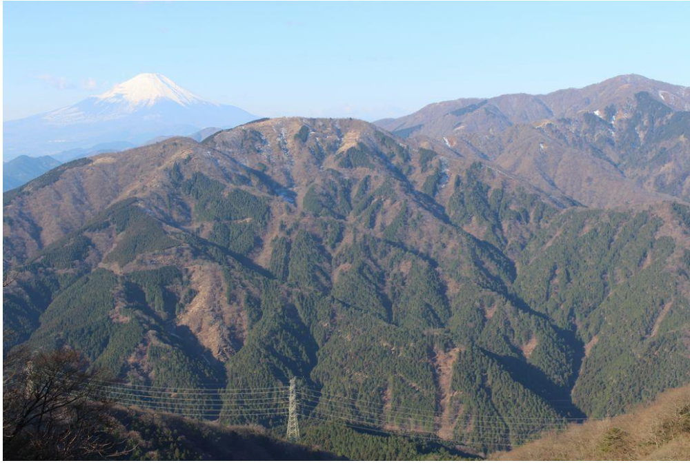
山頂西側より 表尾根と富士山