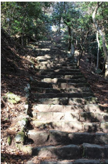
ケーブルの無い昭和30年後半 まではこれを上ってお参りして いたそうです。