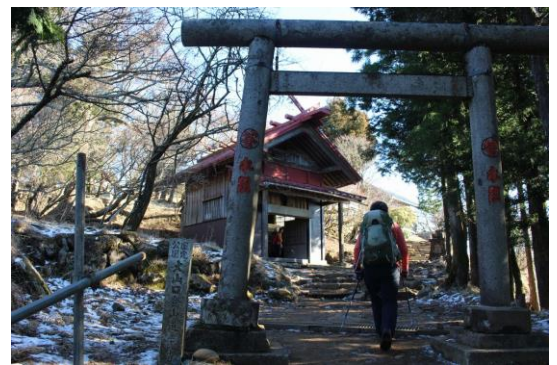
鳥居をくぐり山頂到着