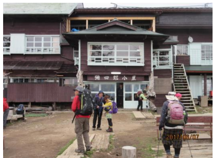
宿泊の弥四郎小屋に到着