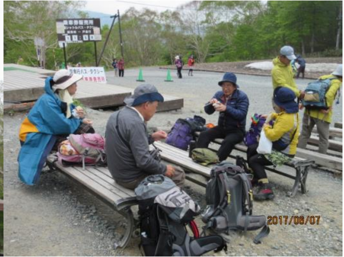
先ずは腹ごしらえ