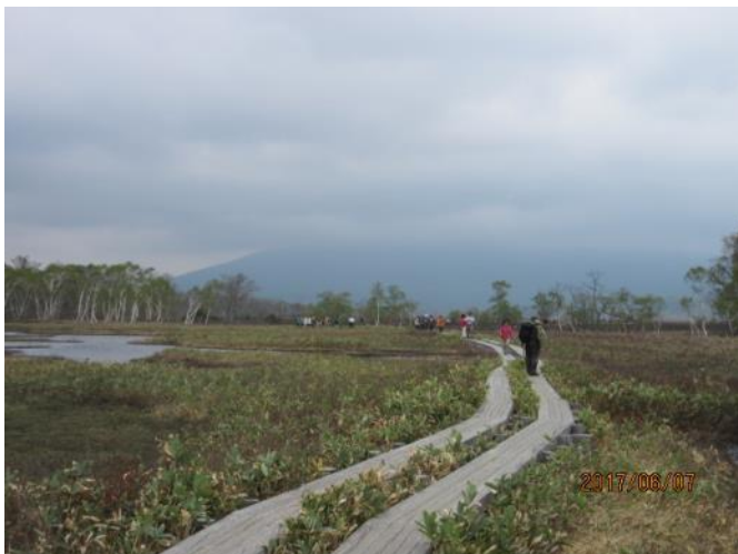
気持ちのいい木道が続きます