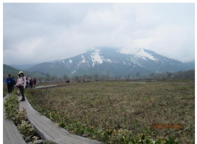
至仏山が目の前です