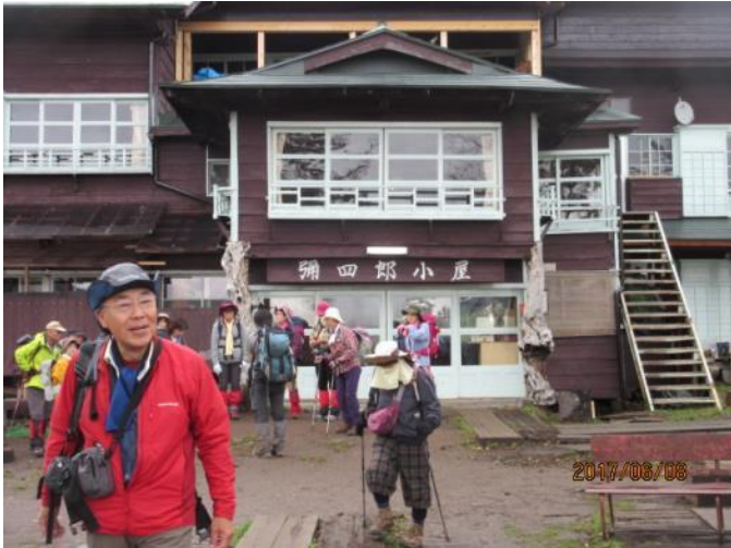
彌四郎小屋を出発！

コース：見晴（7：00）→龍宮小屋（7：25）→長沢頭（9：18）→富士見田代（11：09）→アヤメ平（11：23、11：50）→中原山（12：03）→鳩待峠（14：20）