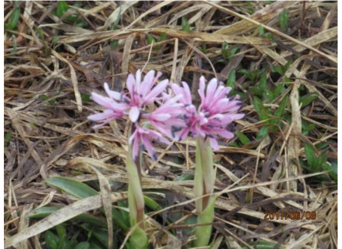
可愛いショウジョウバカマ