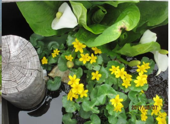
可愛いリュウキンカ