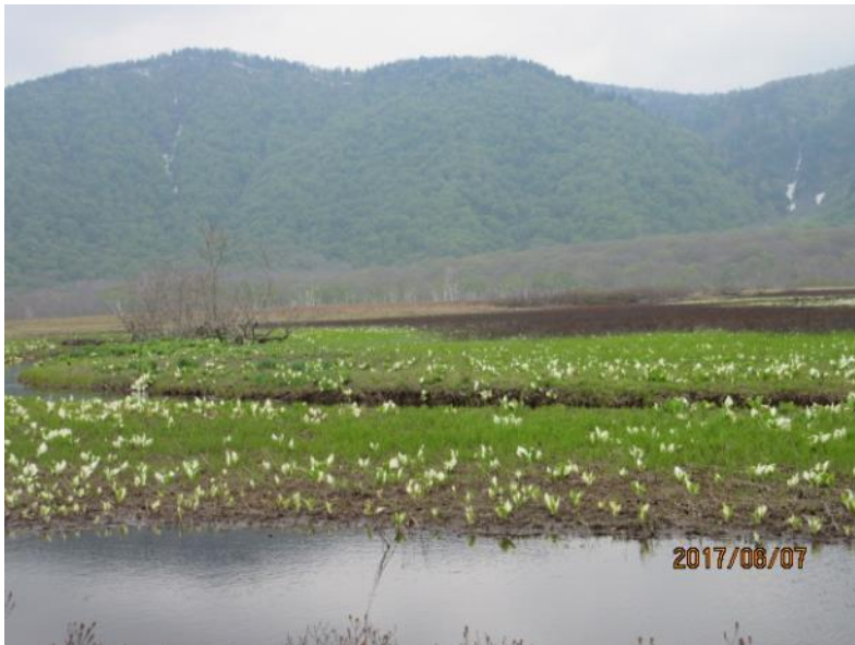
ミズバショウの群生です