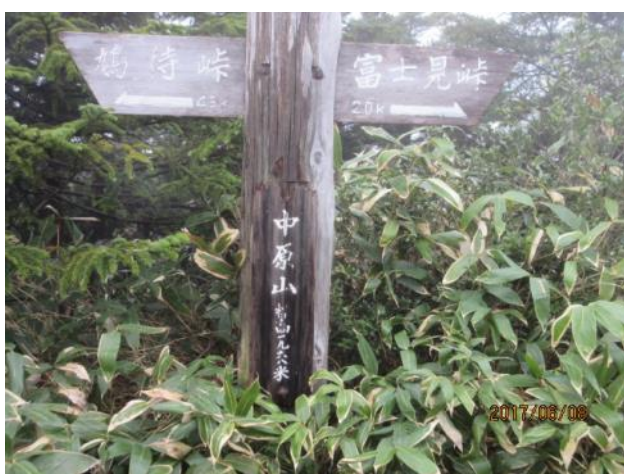
本日の最高峰・中原山