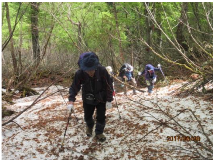
残雪の急登を頑張ります