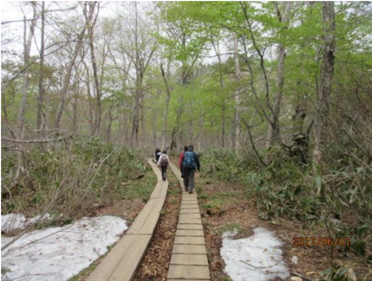
新緑に癒される木道です