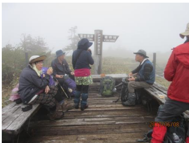
アヤメ平で一休み