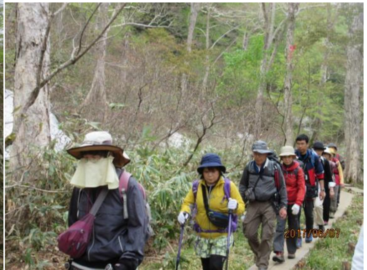
尾瀬ヶ原へ向かって快適な歩きです。