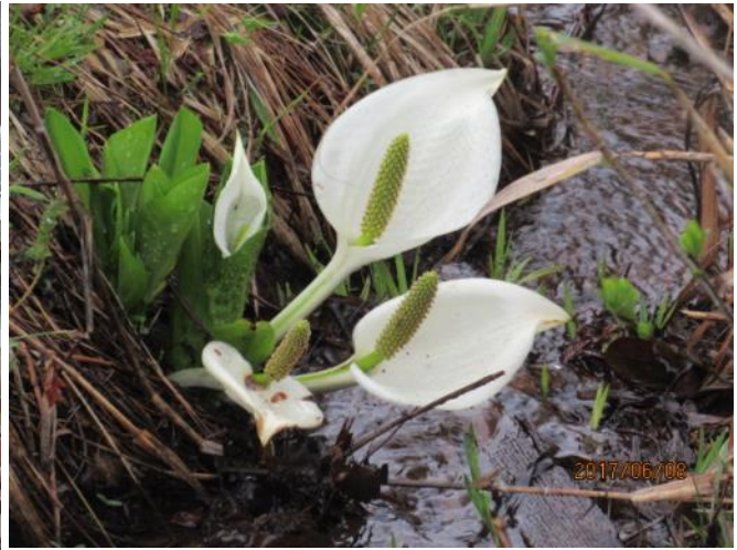
かれんなミスバショウ