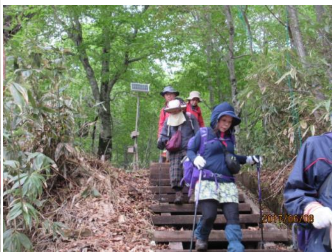
お疲れ様でした。鳩待峠に到着です。