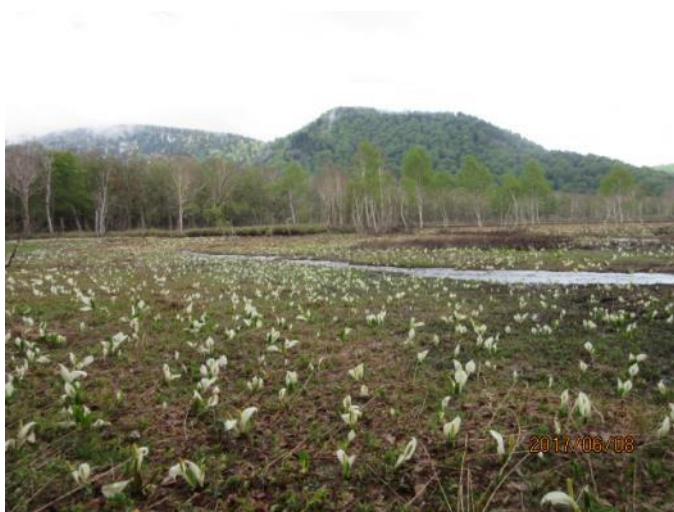
ミスバショウの群生の先にはダケカンバの林