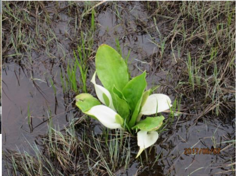
美しいミズバショウ