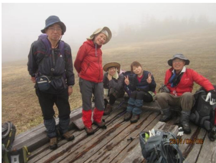
横田代でハイ集合