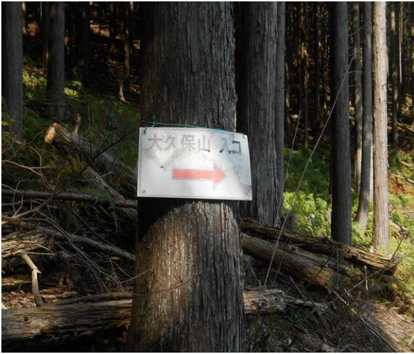
大久保山入り口の標識ですが登山道は不明