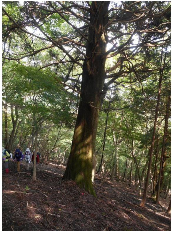
途中に杉の大木を発見