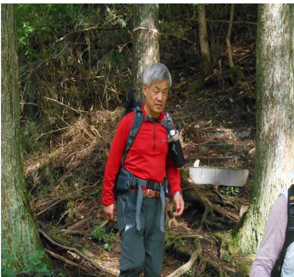
無事に生土に到着