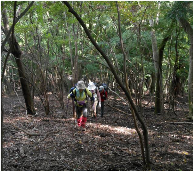
大久保山手前の登り道はないので直進でのぼる。