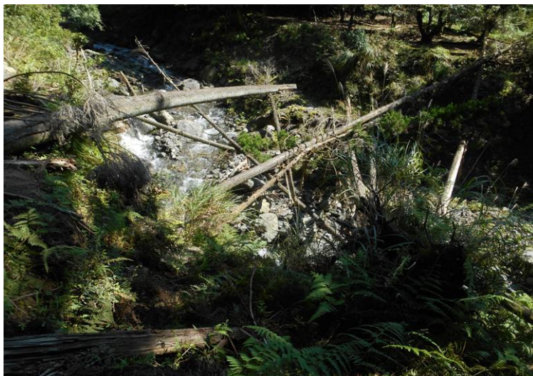
最後の渡渉は倒木の上を歩いて渡った