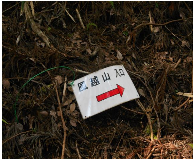
途中の風越山入り口の標識 初めて聞く名前です。