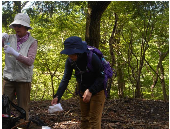
ここが大久保山 山頂と思われる場所 山名標識は見つからない。