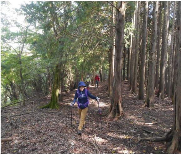
大久保山 山頂近く 山名標識があるか確認しながら歩く