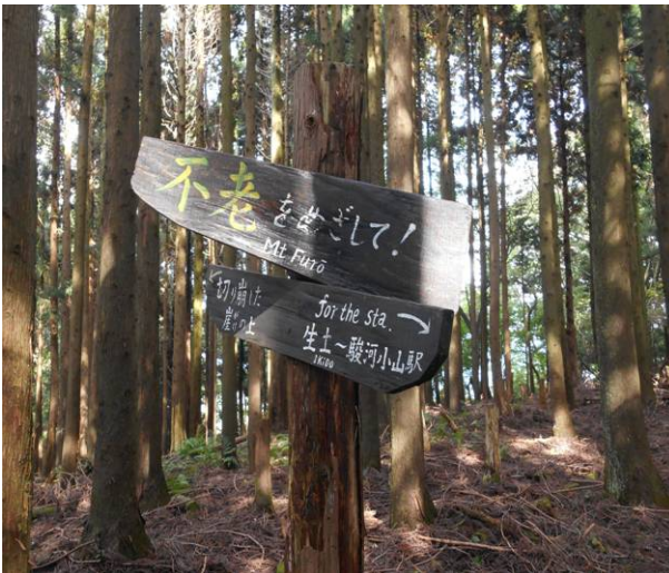
生土-駿河小山駅の標識