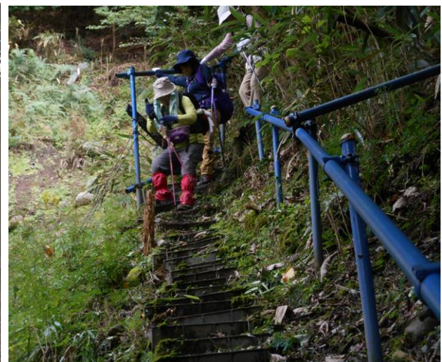
最後の急な階段手すりにつかまって降りる