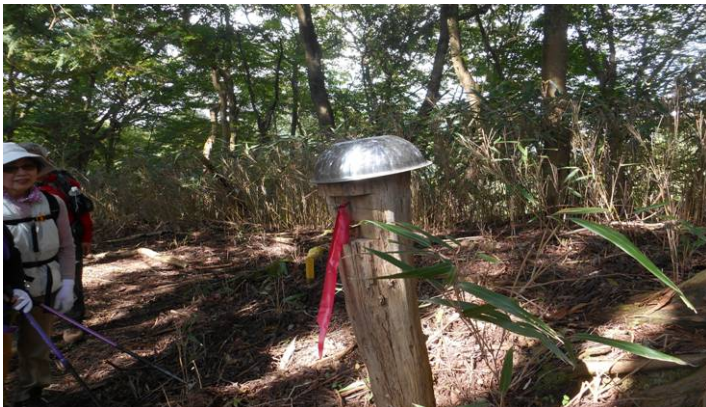
不老山からの一般登山道にでた 塩沢ルートも終わりです。