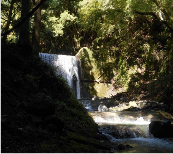
この場所の渡渉はガードレールが置いてありそれを橋の代わりに使用した