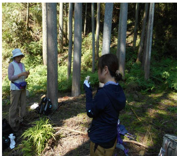
渡渉が終わり一安心で、休憩時間 これからが急な登りとなる