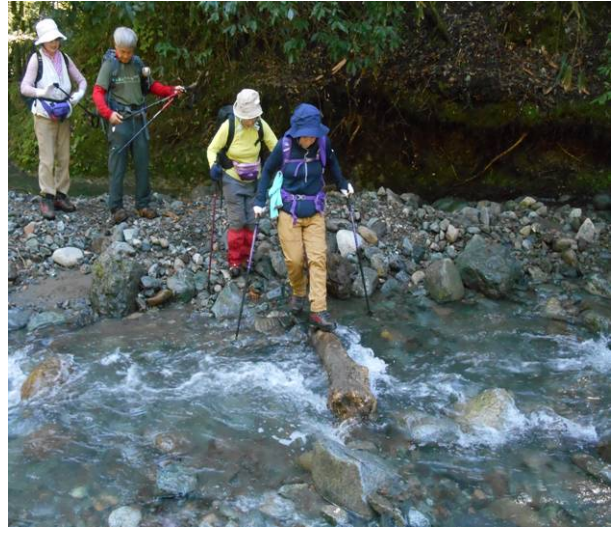
次の渡渉では、流木を置いて橋の代わりに利用渡るのに、かなりのバランスが必要