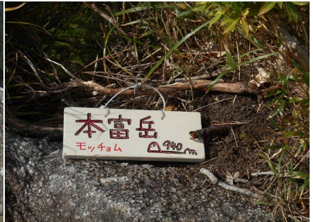
山頂に到着 狭い場所で標識は2個ありました