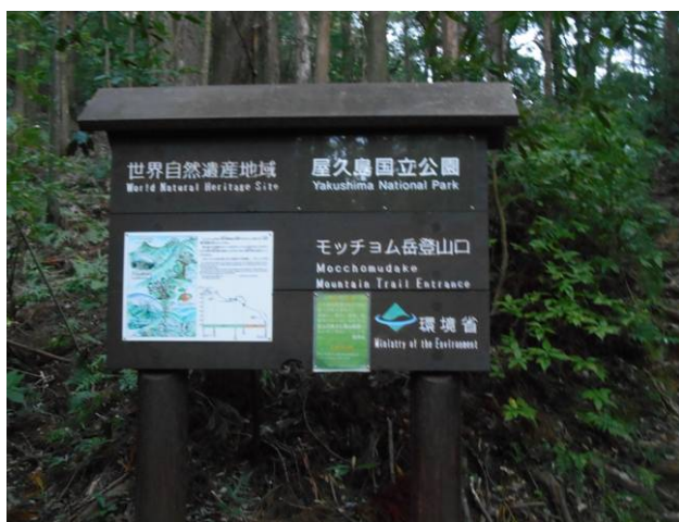
駐車場から2-3分位で登山口に到着

モッコム岳は漢字では、本富岳です、登山口は千尋の滝（せんぴろのたき）から始まる最初万代杉までの間は、急な登りでそこから、モッコム太郎まで下りのルートになり、そこからモッコム岳の見える場所まで、急な登りのルートに、山頂が見えてからのルートはアップダウンの激しいルートになります、最初かなりの長い間下りまた登りを繰り返す尚随所にロープが設置されている、山頂の手前は、大きい一枚岩を約5m位直登するルートです山頂はかなり狭く、遮るものが無い為展望は良いのですが、風がかなり強く吹き抜ける場所で、長時間山頂にいる事は出来ません。