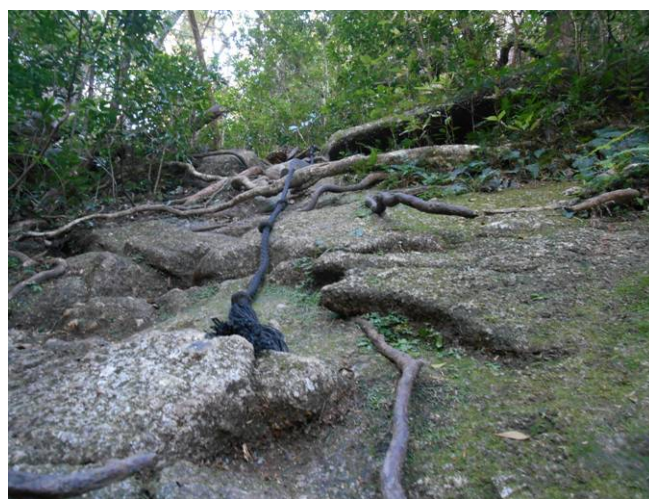
モッコム岳太郎に行く間の急な下り