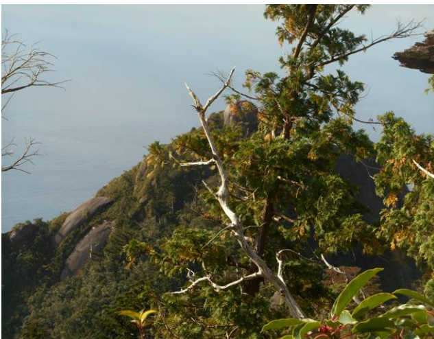
山頂が見える所にきました、少し前に標高900mを過ぎたがここから見ると標高40mとは かけ離れた標高差です ここから山頂までが今まで以上に厳しいルートになる