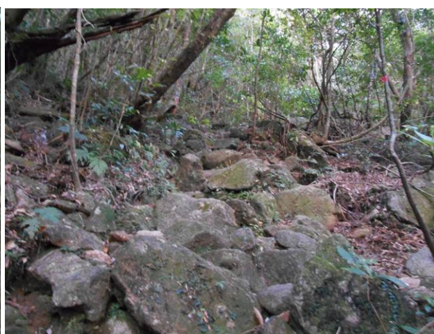
最初はこんな感じの急な登り