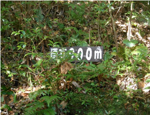
標高表示900m モチヨム岳は940m 標高は後40mですが