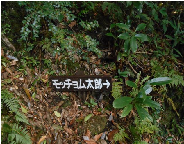
モチヨム太郎（屋久杉）への分岐