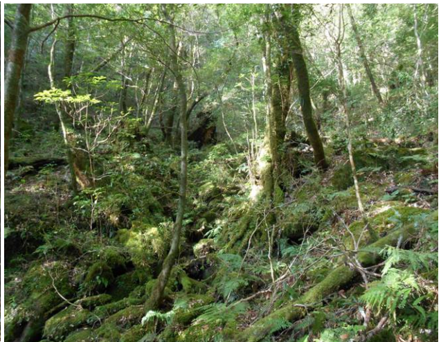
登山道の周辺藪が深い