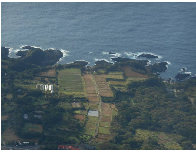
山頂からは360度の展望がある