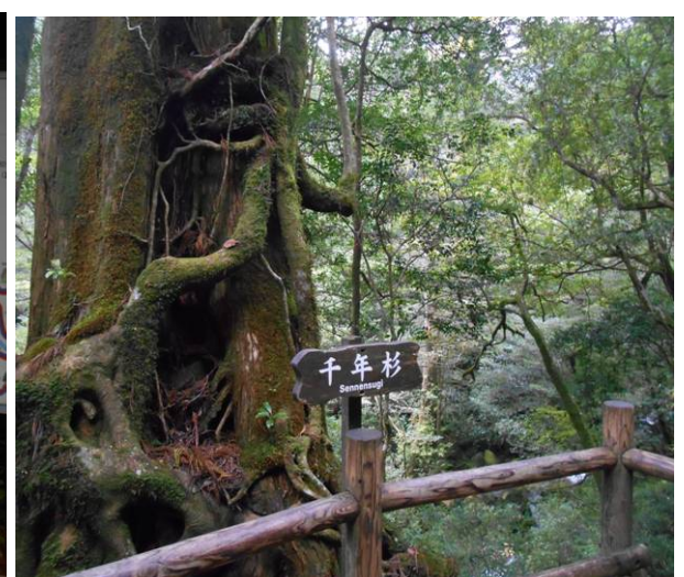
ヤクスギランドに到着 50分コースの散策