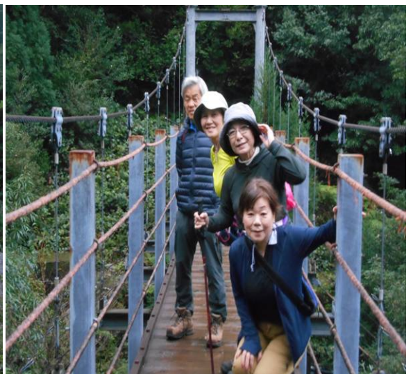
この吊り橋の先が本格的な登山道になる