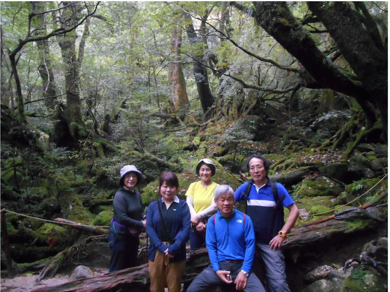
属名もののけの森 現在は苔むす森です。