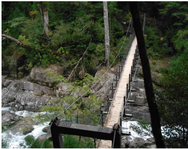
吊り橋を上から この先が大忠青岳登山道