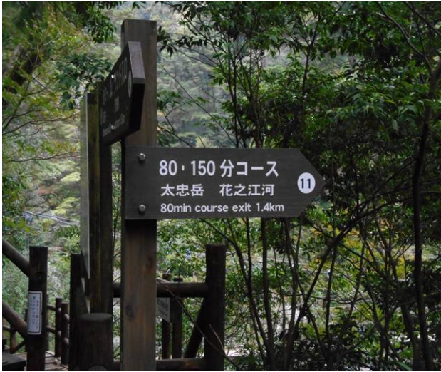
ここから大忠岳、花之江河への登山道分岐