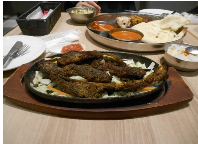
最終日に鹿児島駅で 屋久島ジビエ 鹿肉を食べる。