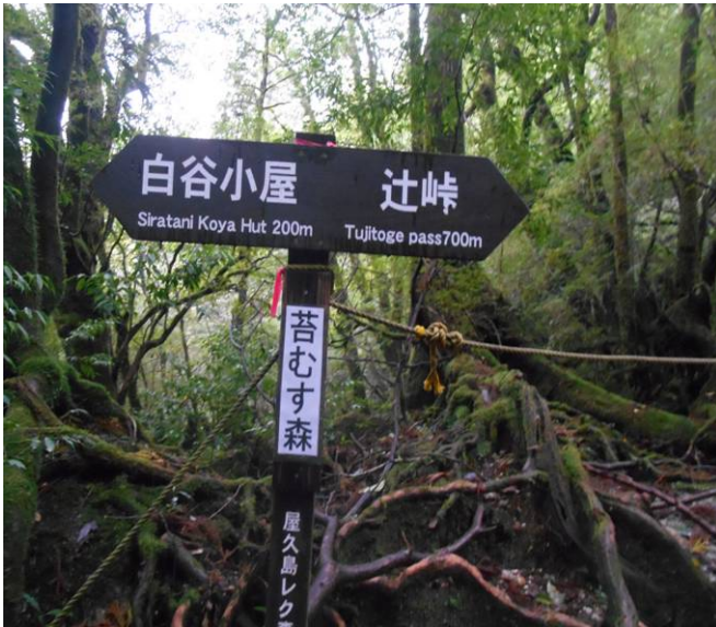
ここらかも辻峠経由で縄文杉に行けます