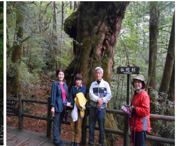
仏陀杉 名前の由来は不明