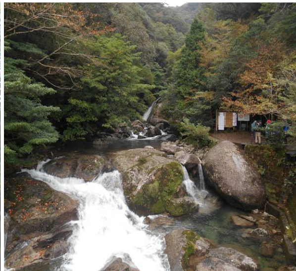
白谷雲水狭の入り口