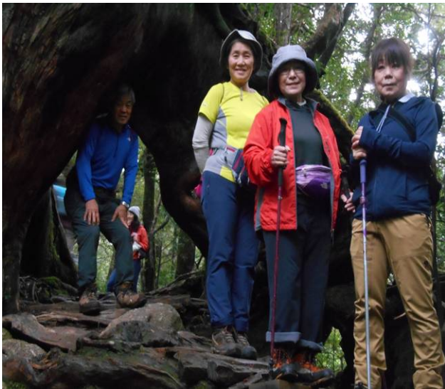
くぐり杉 かなり大きな穴です