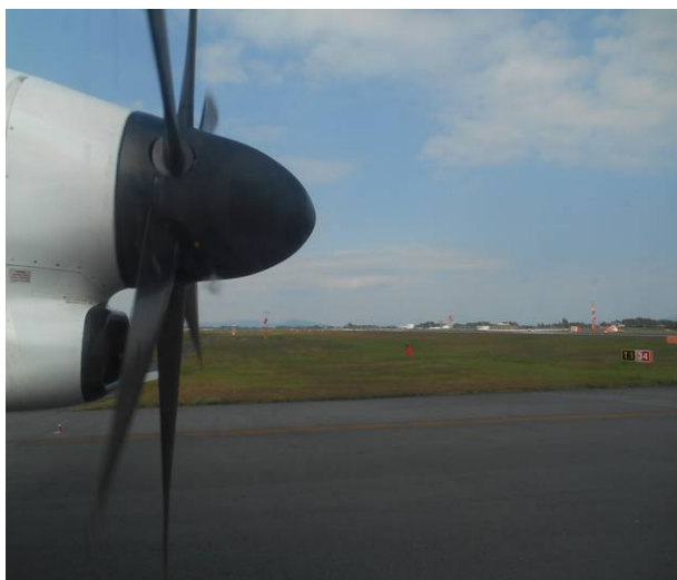
屋久島に向けて鹿児島空港