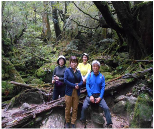
映画に出てくる様な場所