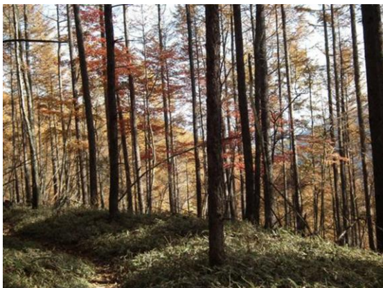
カラマツ林の紅葉

標高差1246m(5.4km)思ったより苦勞した上りだった。本コースは旧道、白州ヴィレッジからの新道を利用すると上り3時間とのこと。