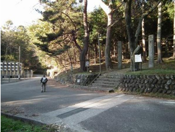
白州・石尊神社登山口より歩き出す

コース：石尊神社 7:50~8:05…1600m三角点 10:20~30…雨乞岳 12:05~32…1600m 三角点 13:40~48…石尊神社 14:58