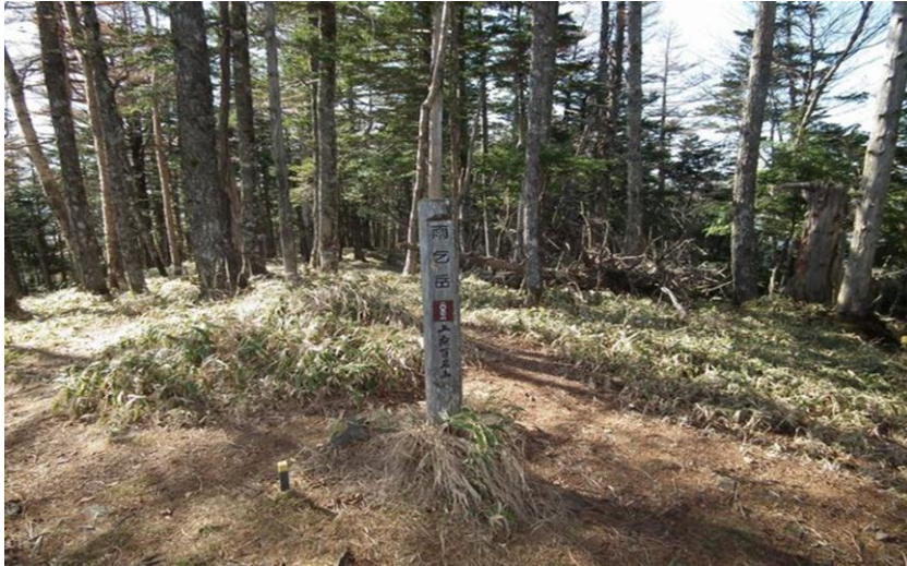
雨乞岳山頂 南側は樹林にかこまれほとんど展望が得られない。 左手奥には鋸岳の稜線がわずかに見える。