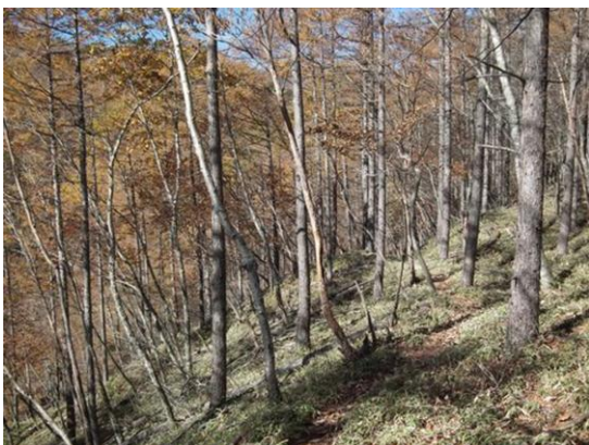
下草は笹となり、細い踏み跡になる

サントリー白州工場裏手にある石尊神社よりスタート、左上写真：100m 先から尾根に取り付く、右写真のような落ち葉の足にやさしい上り、しかし、かなりの急登であり、1600m 付近まで続く…流れる汗！汗！