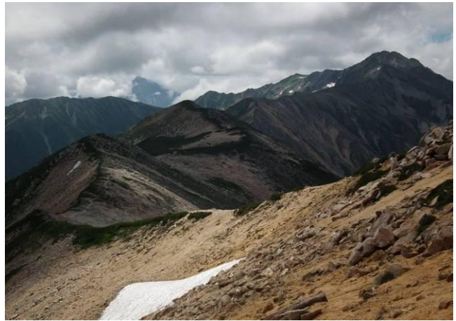
右：赤牛岳を下る。温泉沢の頭から水晶岳への縦走路、見た目より厳しかった。2日目水晶小屋宿泊