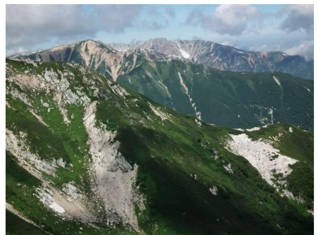
裏銀座縦走路より赤牛岳と薬師岳