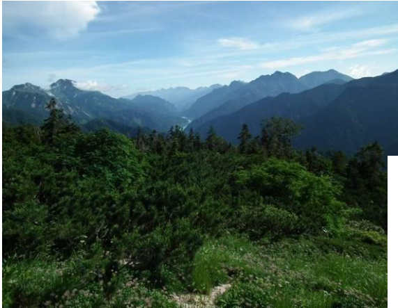
左：長かった読売新道、7/8 地点付近から見る黒部湖と左：雄山、右：針の木岳などの展望